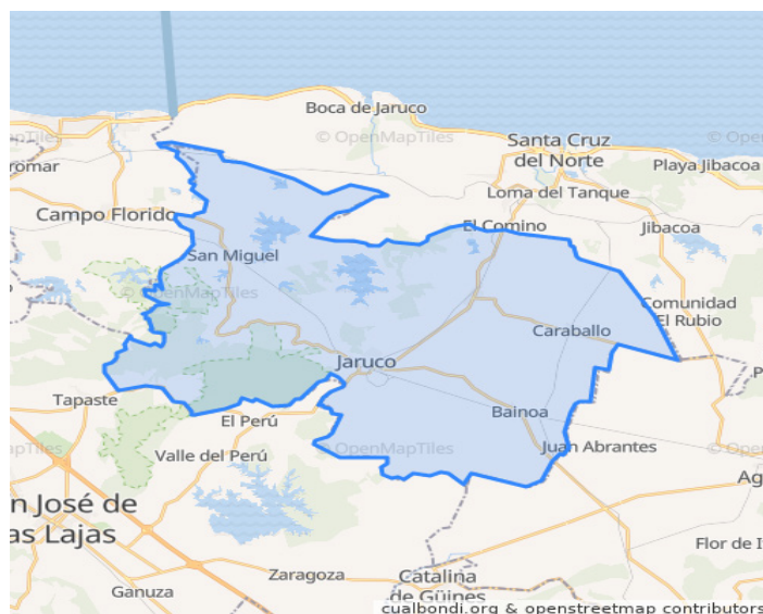
Figura 1. Mapa del municipio Jaruco, provincia Mayabeque, Cuba.

Se escogieron tres fincas en transición agroecológica de cinco años, las cuales tienen similitudes en cuanto a que presentan una topografía llana, el tipo de suelo que predomina es Pardo Sialítico con carbonatos, y son consideradas de buena productividad (Yong, Crespo,