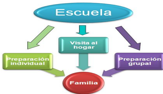
Figura 2. Vías para el trabajo con la familia

Debido a la importancia del papel de la familia en el desarrollo y el aprendizaje de los niños (as), su participación en la educación es esencial. Para fomentar la preparación de la familia y beneficiar las relaciones familia-institución educativa, existen diferentes vías que utiliza la Educación Preescolar, estas son: las visitas al hogar, la preparación grupal y la preparación individual; como muestra la figura 2.