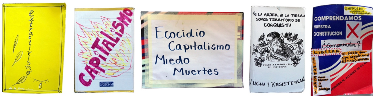
Figura 8: Selección de artefactos: extractivismo.

o amenaza. Françoise Vergès reflexiona que “el miedo no es ciertamente exclusivo del dispositivo colonial pero es preciso recordar que la esclavitud colonial se fundaba en la amenaza constante de la tortura y de la muerte de un ser humano transformado legalmente en objeto” (21). En dicho panorama, Verónica Gago identifica la lógica de pensar sobre las mujeres y cuerpos feminizados “como ‘colonias’, es decir, territorios de saqueo sobre los que se extrae riqueza a fuerza de violencia” (95), de manera que la sujeción entre miedo, violencia y colonialidad incorpora también los problemas del territorio, agregando que quizá este es uno de los motivos del auge de activistas latinoamericanas: mujeres, lesbianas, no binarias y trans, cuyas identidades responden a la colonialidad del género: ellas son “las que han inventado la idea-fuerza de cuerpo-territorio” (96) vinculada a las luchas medioambientales.