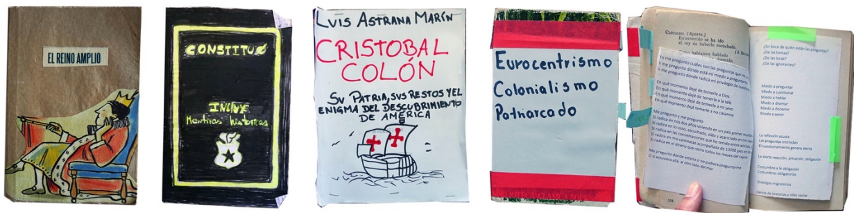
Figura 6. Selección de artefactos: colonialidad y constitución.

De esta manera, la autora construye el concepto “sistema de género moderno/colonial” dentro del que operan opresiones que funcionan en relación con el género, el sexo, la etnia, la clase, entre otros aspectos. Como indica el colectivo LASTESIS, este enfoque es clave para los feminismos interseccionales puesto que “responde a nuestro contexto de pasado/presente colonial, patriarcal y neoliberal” ( Polifonías 82). Tal conciencia se manifiesta en HMM : recordemos que la fecha original de la convocatoria estaba vinculada a la llegada del hombre blanco europeo al continente, de modo que la reflexión en torno a la colonialidad es propiciada desde la invitación inicial.