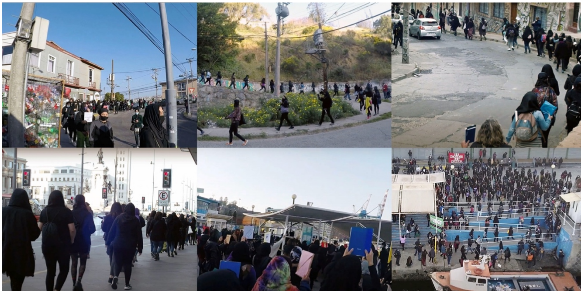
Figura 2. Recorrido de la intervención.

De pie frente a la bahía, l-s participantes arrojaron las constituciones al interior de la lancha Karina Maciel –arrendada para tal efecto– al tiempo que se escuchaba una nueva consigna denominada “conjuro”, que rezaba: