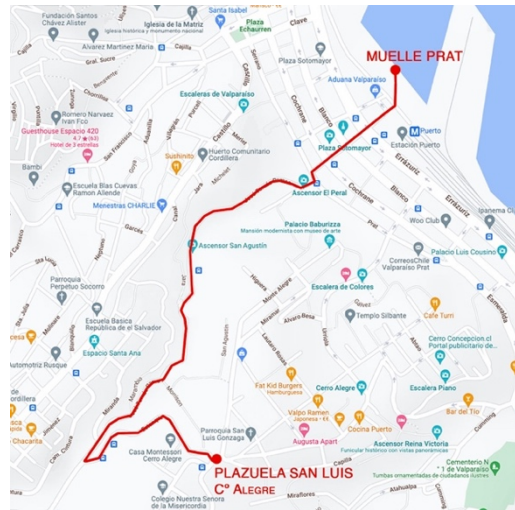
Figura 3. Mapa y trayecto.

El trayecto (Fig. 3) fue definido por LASTESIS luego de que en la reunión l-s participantes escogieran dónde finalizar la intervención entre los tres puntos de llegada propuestos por el colectivo en el borde costero: Caleta Portales, Muelle Barón y Muelle Prat, cuyos nombres aluden a figuras del repertorio nacional: Diego Portales, Ambrosio O'Higgins y Arturo Prat, respectivamente, lo que propiciaba referencias históricas. La selección del Muelle Prat se debió a lo que implica su figura como héroe y a la relevancia de la Guerra del Pacífico en la conformación del Estado-nación moderno.