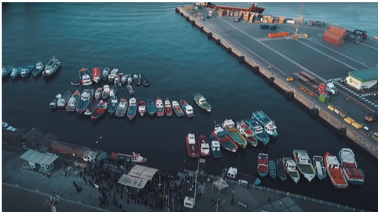
Figura 9: Hoy, hundimos el miedo. Bahía de Valparaíso.