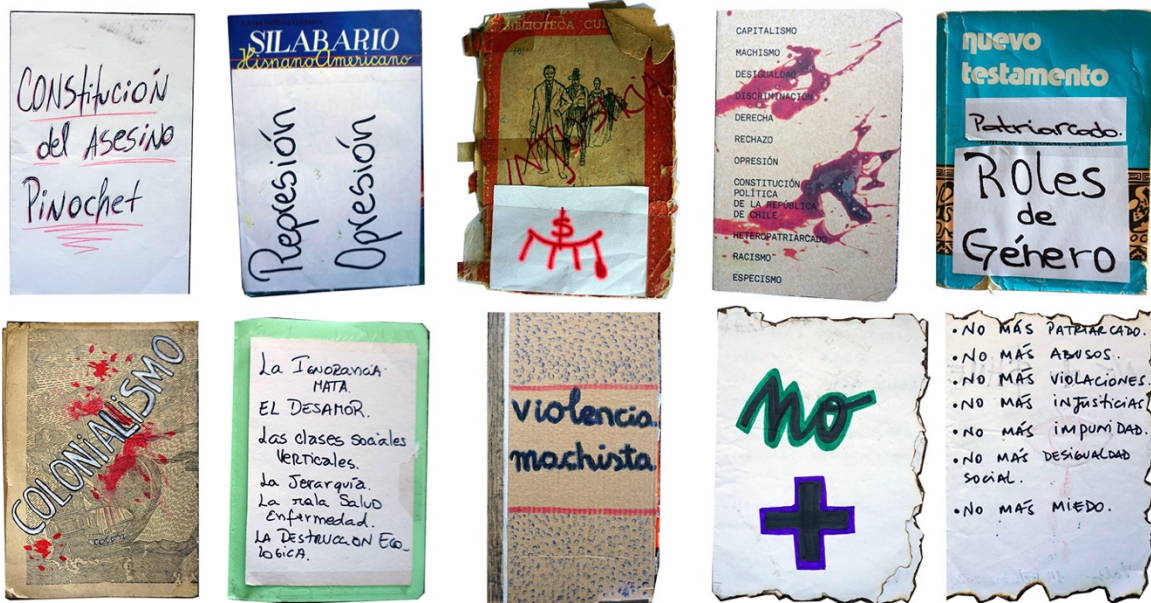
Figura 7. Selección artefactos: miedos.

Al analizar la intervención podemos ver que son capas y capas de elementos en relación que funcionan rizomáticamente, superponiéndose en un collage de cuerpos y artefactos. No es una narrativa de memoria lineal, no constituyen un relato específico, de ahí que la intervención se sitúe en vías de visibilidad dando cuenta del dispositivo, que tiene al miedo como elemento articulador.