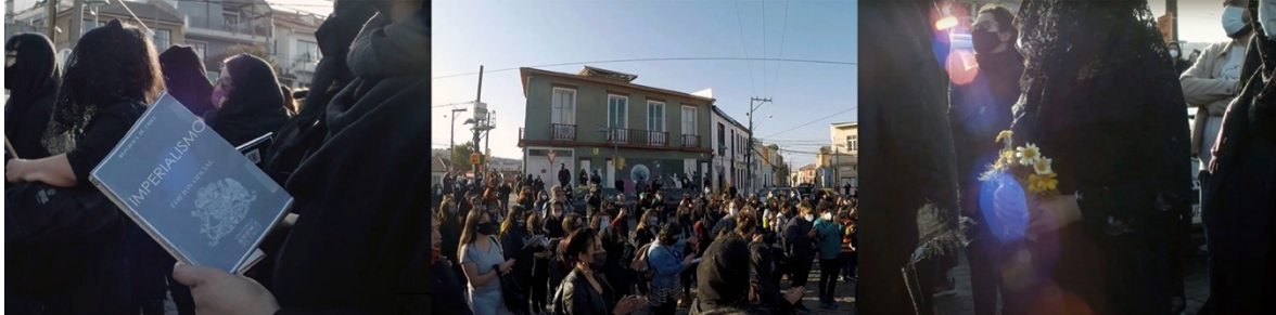
Figura 1. Momento previo al inicio. Plazuela San Luis, Valparaíso 11 .

La cita para la intervención fue a las 18:00 horas en la plazuela San Luis de Cerro Alegre. Al grupo se le solicitó vestir de negro y llevar velos del mismo color en señal de luto, junto con mantener las restricciones sanitarias como uso de mascarillas y distancia física. Además, cada participante debía llevar una “Constitución”. Proponemos pensar dichos materiales como “artefactos”, aludiendo a la etimología latina ars factus , es decir, objetos hechos con arte, y a la acepción moderna del término, que lo asocia a “un propósito específico” que, en el contexto de la intervención, aparece expresado bajo la idea de “hundir el miedo”.