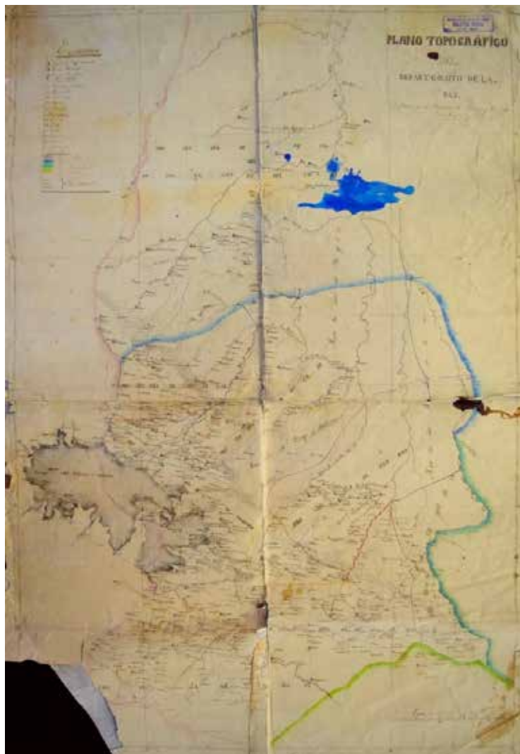
Figura 1. Plano topográfico del departamento de La Paz, ca. 1845-1846 (93,5 x 62,8).