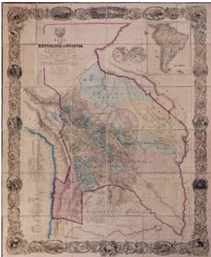
Figura 3. Mapa de la República de Bolivia, 1859 (180 x 147).