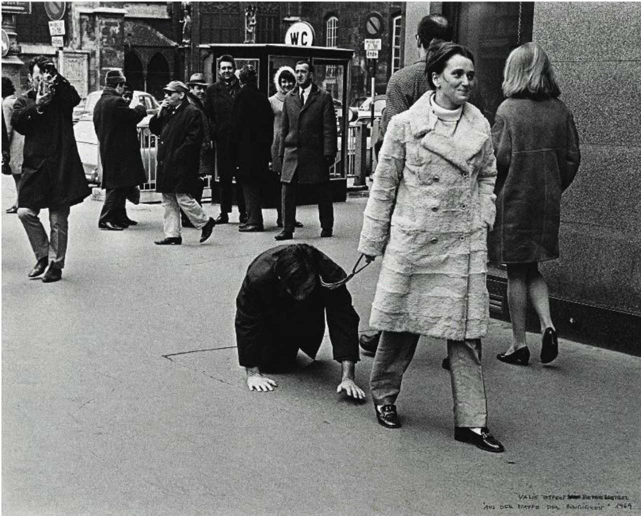
Fig.3. Valie Export-From the Portfolio of Doggedness, 1968