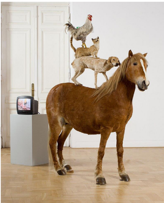
Fig.4. Katarzyna Kozyra-Pyramid of animals, 1993

La educación del cuidado de la alteridad animal en el arte animalista.