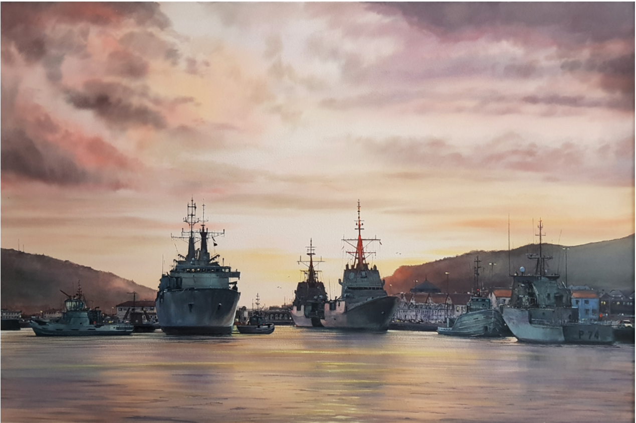
Ilustración 3. Arsenal de Ferrol

GC: Me llama mucho la atención, que en la actualidad tengamos prácticas artísticas que son muy minoritarias, -estoy pensando por ejemplo en la poesía experimental o en la performance-, pero que reciben un gran cariño por parte del mundo académico y que se traduce en abundante bibliografía teórica, histórica y crítica; mientras tanto, quienquiera estudiar la acuarela hoy en día se va a encontrar que dentro de la literatura de la acuarela es más fácil dar con una tipología muy concreta de publicaciones, como es el caso del manual, y en cambio hay una gran escasez de literatura teórica, histórica o crítica. ¿Tienes la misma impresión?