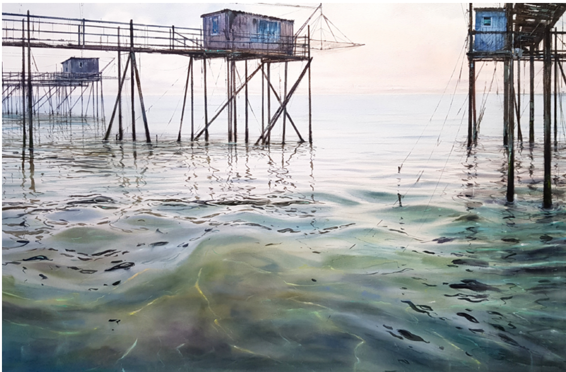
Ilustración 4. Carrelets

GC: En tu libro Curso de Acuarela a través del paisaje comentas lo importante que es para ti viajar y el papel tan estimulante que hace en tu acuarelas; es el momento de la mirada fotográfica, de comenzar a preparar y a seleccionar los motivos que te interesan, obteniendo de aquí un reflejo, de este lado una arquitectura... ¿con qué criterios compones tus imágenes y qué elementos te parecen irrenunciables en tus acuarelas?