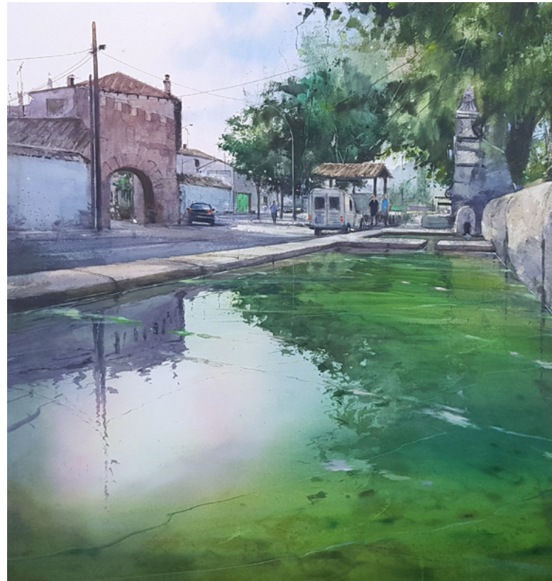
Ilustración 2. Uclés

Como acuarelista está especializado en el paisaje, y más en concreto en el paisaje plein air. Su obra es un ejemplo de maestría técnica. Sus imágenes son una forma de placer sensorial: nuestra mirada quiere vagar por sus paisajes; recorrer las luces y las sombras que los habitan; entrar y salir por sus temperaturas; pasear sin prisa por las transiciones tonales y recrearse en las texturas. Un elemento característico de sus acuarelas es el tratamiento hipnótico que hace de los reflejos en el agua: el reflejo de un cielo