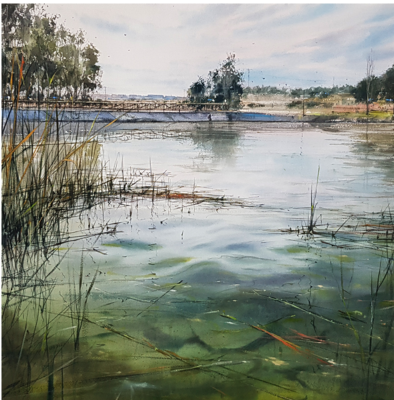
Ilustración 1. Butarque, Leganés.

Enumerar todos sus méritos puede convertirse en una tarea ardua, pero uno puede comprender muy bien el tamaño de su figura con estos datos: Su obra y su enseñanza está presente en casi todos los continentes a través de exposiciones, talleres y publicaciones. Es miembro de las tres asociaciones de acuarela más importantes de Estados Unidos. La marca de pinceles Escoda ha diseñado su propio set de pinceles (Paletina Última, petit gris y perla) y lo reconoce con el título de Embajador de la Marca de Pinceles Escoda; ha colaborado con la marca de pintura Daniel Smith para diseñar el set de diez colores Pablo Rubén y además es también embajador de Daniel Smith. Su especialización en el plein air le ha llevado a obtener más de 500 galardones artísticos nacionales e internacionales. Ha publicado varios libros; uno de ellos, el más importante y muy vendido, su Curso de acuarela a través del paisaje (Anaya, 2021), así como varios libros de viaje en colaboración con escritores: Florencia y Lisboa . Su cuenta de Instagram tiene más de sesenta mil seguidores. Todos estos datos transmiten la sensación de que Pablo Rubén podría tener alguna ligera idea de lo que hace.