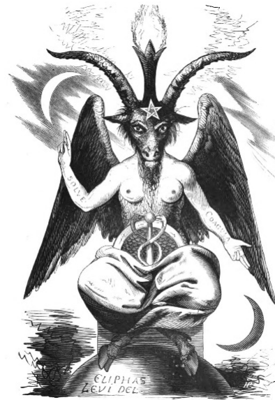
Figura 2. Frontispicio al segundo tomo del libro: Lévi, Éliphas. Dogma y ritual de la alta magia . París: G. Baillière, 1861.