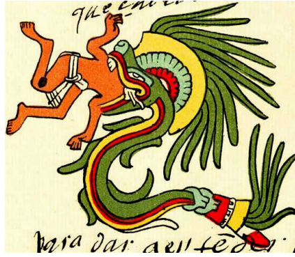
Figura 6. Quetzalcóatl en su forma de Serpiente Emplumada. Códice Telleriano-Remensis , Biblioteca Nacional de Francia (París), f. 40.