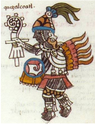
Figura 5. Ce Ácatl Quetzalcóatl rey-sacerdote de Tollan. Códice Matritense del Real Palacio de Madrid , f. 261v.