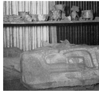
Figura 4. Cabeza de serpiente (mural) y cerámica de entierros encontrados en Zacuala. Séjourné, 1956.