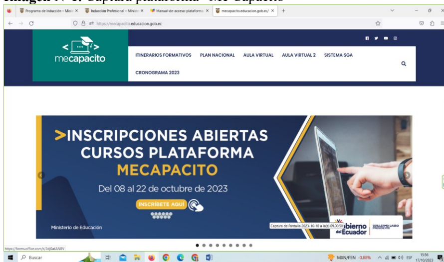
Imagen N°1. Captura plataforma “Me Capacito”