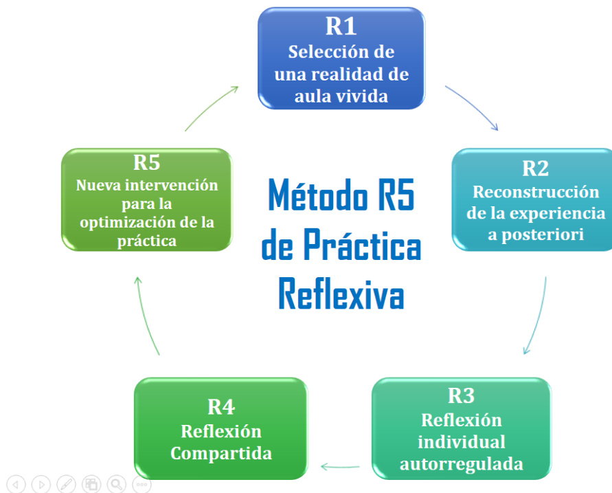
Figura 1. Método R5 de Práctica Reflexiva.