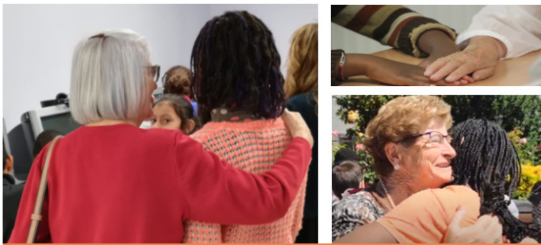
Ilustración 3. Ejemplo de fotografías analizadas.

Por último, en la experiencia intergeneracional la relación de grupo se ha desarrollado en diferentes espacios adaptados a la acción y al contexto. El grupo receptor se ha potenciado a través de acciones académicas (n = 4, 7,4%) y lúdicas (n = 7, 13,0%). Esta combinación de acciones ha supuesto el afianzamiento de la relación del grupo formado por varias generaciones (ilustración 3).