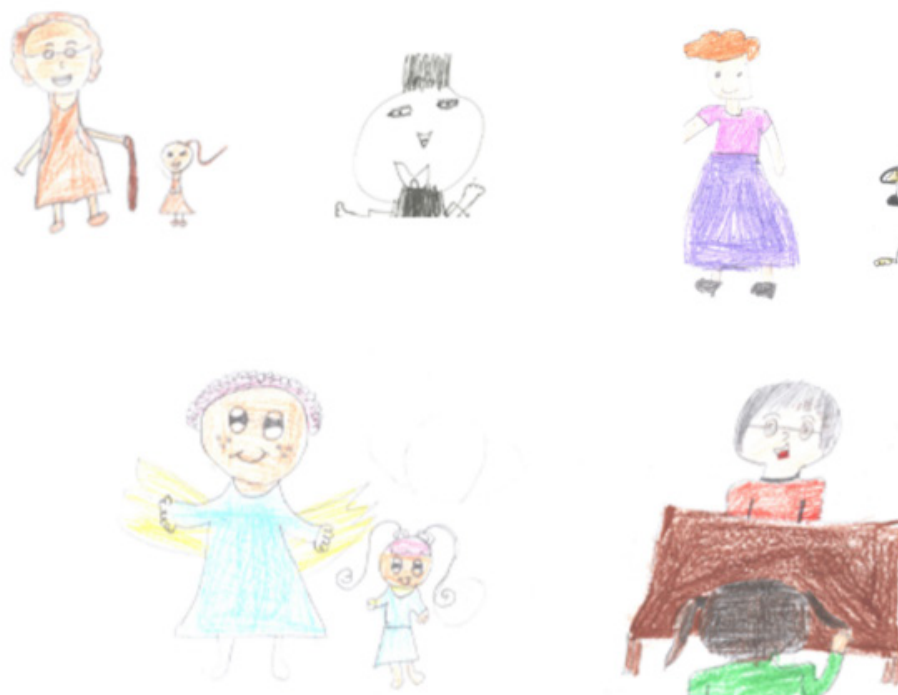
Ilustración 1. Ejemplo de dibujos analizados.