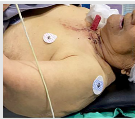
Figura 1. Imagen de ingreso de la paciente que muestra el arma blanca con más de 50 % de penetración en región cérvico-torácica, anterior y derecha

Al examen físico en regular estado general, hemodinámicamente estable, consciente, vigil,