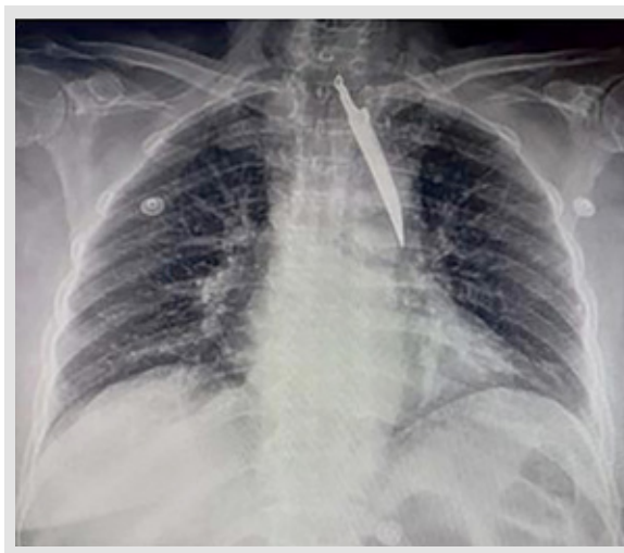
Figura 2. Radiografía de tórax PA (postero-anterior), se observa cuerpo extraño en topografía de mediastino levemente lateralizado a la derecha en intimo contacto con pared traqueal

Por otro lado, se realiza tomografía de cuello y tórax con contraste, donde se evidencia un objeto cortopunzante que atraviesa el cuello que llega hasta región posterior del tórax izquierdo, pasando periféricamente por el borde izquierdo de la tráquea, esófago, a 3 mm del cayado de la aorta y la arteria subclavia izquierda, sin causar lesión. Adyacente a estas estructuras no se observa colecciones, contacta los cuerpos vertebrales D3 y D4 hasta segmento posterior del quinto arco costal izquierdo causando lesión del pulmón a nivel del lóbulo superior izquierdo, sin ocasionar neumotórax, asociado a leve enfisema de partes blandas (ver Figuras 3 a, b, c y d).