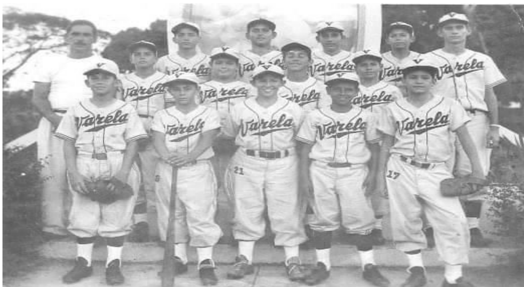
Figura 5. Equipo de béisbol de la Ciudad Estudiantil “Padre Félix Varela”

La práctica del atletismo también estuvo presente en los colegios colombinos. En el periódico “Adelante”, del 2 de septiembre de 1954, aparecen las representaciones por Matanzas