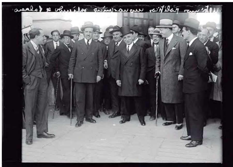
Foto 18. “Últimos políticos monárquicos saliendo de Palacio”, Gerardo Contreras, 1931 (Inv. 00023165)

También tenemos testimonios de las obras urbanísticas que tuvieron lugar en este primer tercio del siglo. Obras como esta imagen que nos muestra una toma desde lo que hoy en día es la Plaza de España, con una Gran Vía aún sin levantar en 1928 (foto 19).