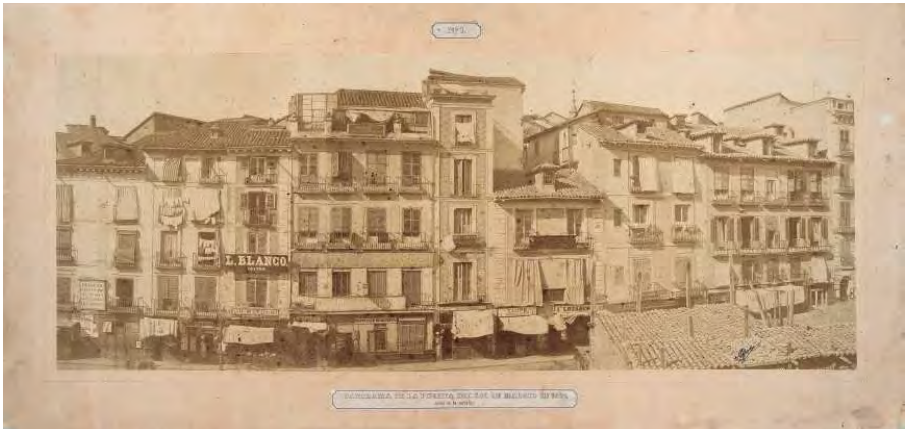
Foto 3. “Panorama de la Puerta del Sol de Madrid en 1857 antes de la reforma”, Clifford, 1857 (Inv. 00010.133)

En estas fotografías se pueden apreciar estos derribos que se fueron realizando, primero, de las partes centrales de la nueva plaza y luego, de los laterales, donde actualmente se encuentra el edificio de la pastelería “La Mallorquina”. También hay imágenes de las estructuras de los nuevos edificios. Fue un proceso muy laborioso, pero magníficamente documentado.