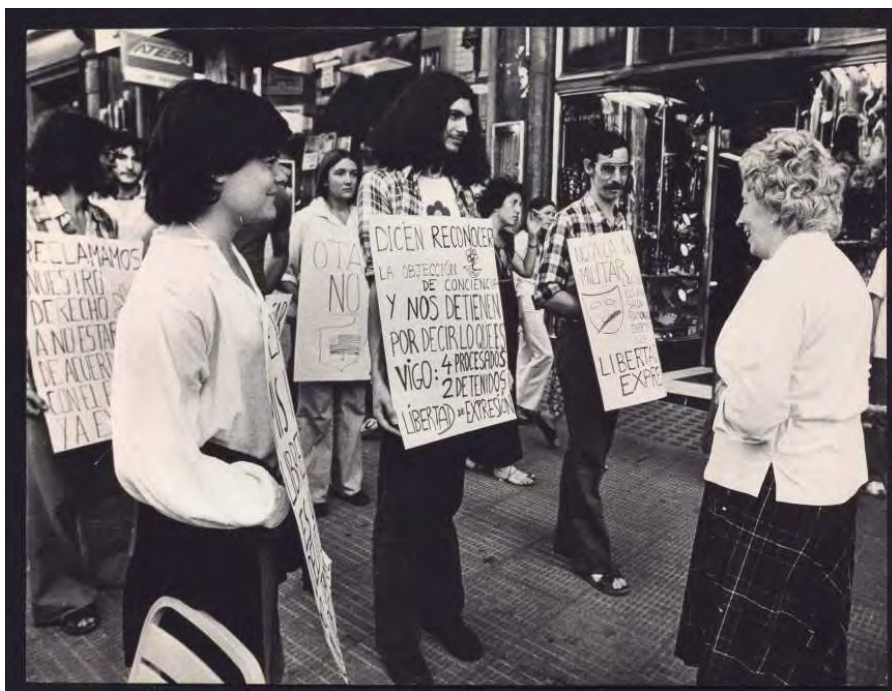
Foto 26. “Objetores de conciencia delante del Ministerio del Ejército”, 1978 (Inv. 2019/5/150)

No faltan tampoco las imágenes relativas al paisaje urbano: atascos, escaparates, bocas de metro, las calles y sus gentes, y sus rótulos urbanos, o incluso la lacra de la droga, dando una imagen de lo que fue el Madrid de los primeros años 80.