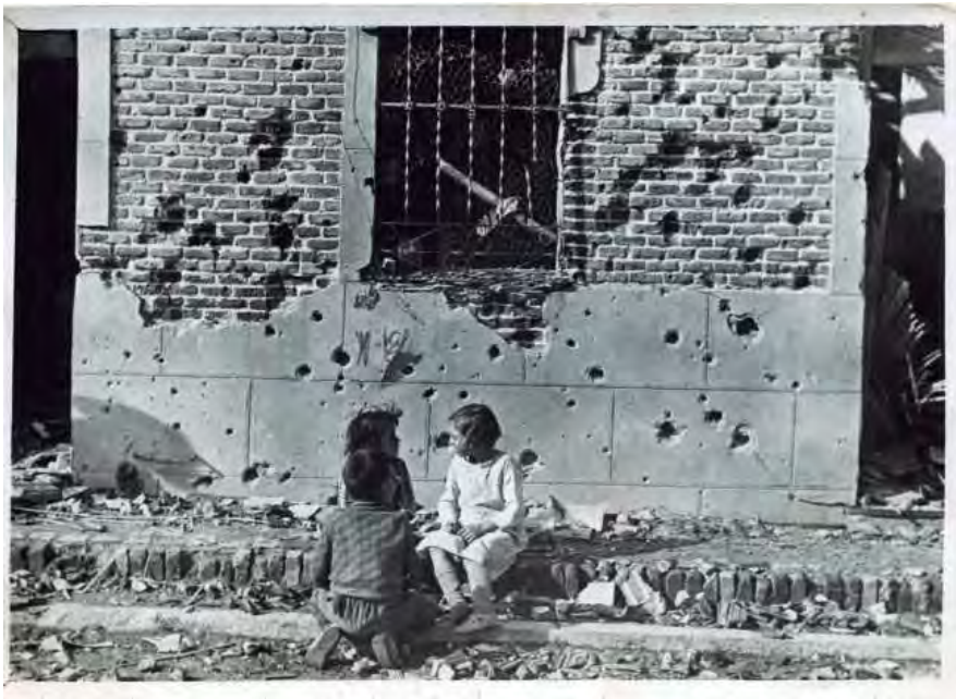
Foto 20. "La guerre en Espagne" Robert Capa, 1937 (Inv. 2009/4/002)

En el caso de la Guerra Civil es imprescindible mencionar la firma Robert Capa. Aunque en ocasiones se ha atribuido el nombre al pseudónimo de Endre Ernő Friedmann, lo cierto es que bajo esta firma se comercializaron los reportajes que tanto él como Gerda Taro, su mujer, hicieron de la Guerra Civil española. El Museo de Historia posee una pequeña muestra con imágenes tomadas en las inmediaciones de Madrid en 1937 y esta famosa foto de la casa de Vallecas donde captó a unos niños jugando junto a una casa acribillada, casa que hoy en día aún existe (foto 20).