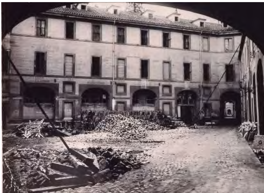
Foto 15. "Patio de coches"