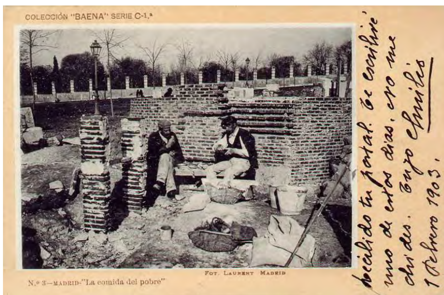
Foto 9. “La comida del pobre”, ca 1903 (Inv. 00025.318)

Pero la mayor aportación que han tenido las postales a la historia de la fotografía de Madrid, es que, debido al coleccionismo antes mencionado, se necesitaban cantidades ingentes de fotografía y sobre todo distinguir destacar sus series. Agotado el tema de monumentos, comenzaron a buscar otros motivos y gracias a ello tenemos fotografías maravillosas de tipos populares que recogen, sin intención, temas tan importantes, y a veces duros, como la inmigración, la pobreza, el trabajo infantil, etc. (foto 9)