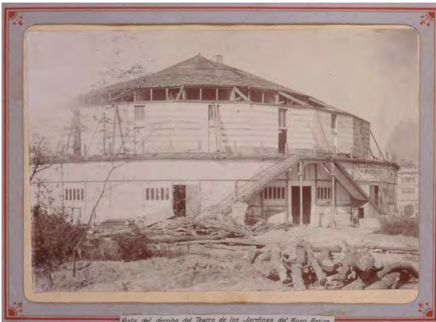
Foto 14. "Vista del derribo del teatro de los jardines del Buen Retiro", ca. 1914 (Inv. 00006.760)