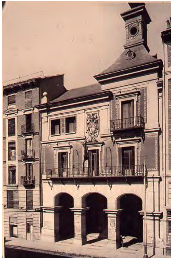
Foto 17. "Casa de Socorro de Latina"

momento, sobre todo, es curioso el fondo de las casas de socorro diseminadas por toda la ciudad. La imagen que aquí os mostramos, corresponde a la Casa de Socorro de Latina (foto 17)