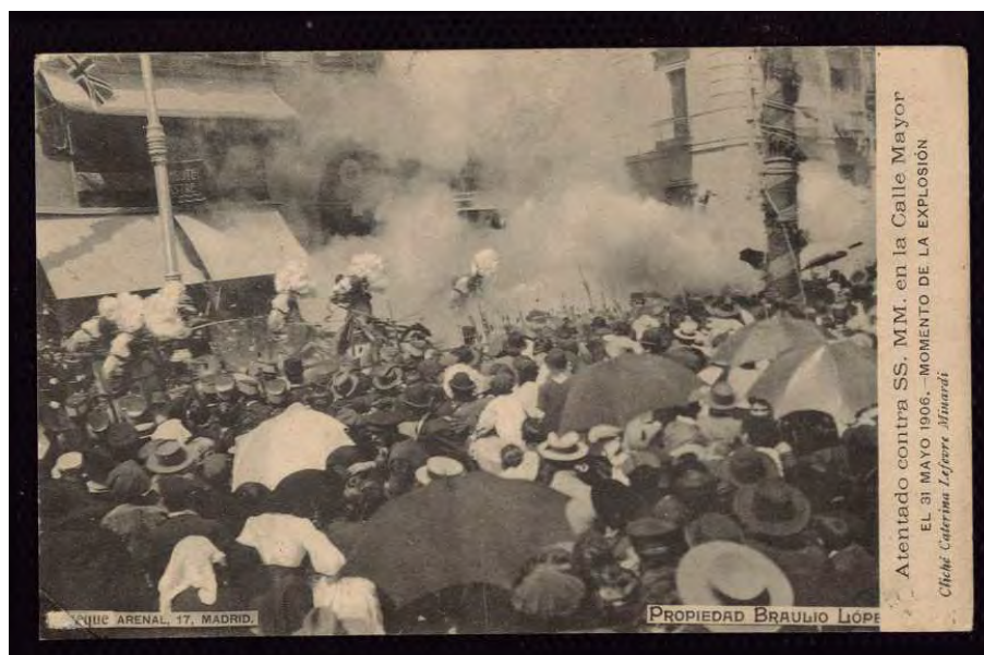
Foto 11. “Atentado contra SS.MM. Alfonso XIII y Victoria Eugenia, en la calle Mayor” Postal del taller de Manuel Palomeque, 1906 (Inv.1990/009/0322)