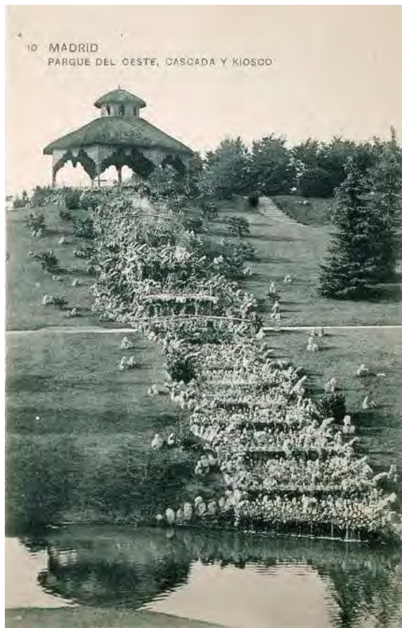
Foto 8. “Parque del Oeste. Cascada y kiosco”, Hauser y Menet, 1920-1925 (Inv. 00021.244)

Gracias a estas postales conocemos muchos rincones de Madrid ahora desaparecidos como la Cascada del Parque del Oeste y el quiosco superior, que sucumbieron a los combates durante la Guerra Civil (foto 8)