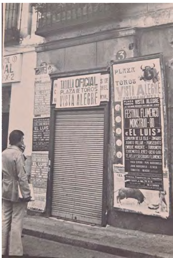
Foto 27. “Taquilla Oficial de venta de entradas de la Plaza de toros de Vista Alegre”, Antonio Díaz Yagüe, década de los 80’

También recogió los testimonios sociales de los años 80: bares, pintadas, locales alternativos, etc. dibujando así esa movida madrileña de fama internacional. Y llega hasta la primera década de este siglo, con temas tan mediáticos como el “No a la guerra”, que inundó nuestra ciudad de mensajes reivindicativos en muros y pancartas, entre 2002 y 2003.