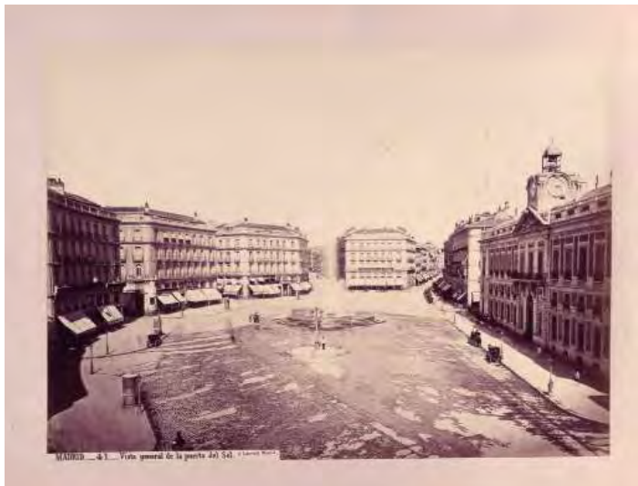
Foto 4. “Vista General de la Puerta del Sol”, J. Laurent, ca. 1870 (Inv. 1997/042/0002)

Al final de dicho proceso, Laurent hizo un reportaje de cómo había quedado la plaza, incluso cuando aún estaba cerrada al público y gracias a ello, tenemos imágenes sin personas, ni carruajes. (Foto 4).