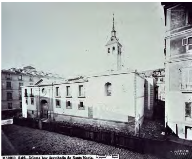
Foto 2. “Iglesia hoy derribada de Sta María”, Laurent, 1867. (Inv. 00002.721)

Son imágenes que nos muestran un Madrid muy conocido por documentos, libros, crónicas, etc., pero que, sin estas imágenes, careceríamos una idea totalmente realista de su existencia. Estamos hablando, por ejemplo, de la Iglesia de Santa M a (foto 2), una de las más antiguas de la ciudad, con un origen románico. Estaba situada en la esquina entre las calles Mayor y Bailen, frente a la Catedral de la Almudena. Fue demolida en 1868 para el ensanchamiento de la calle Bailen y la remodelación de su entorno. Laurent la fotografió en 1867 cuando ya se conocía cuál iba a ser su futuro y por eso la publicó con el título Iglesia, hoy derruida, de Santa M a .