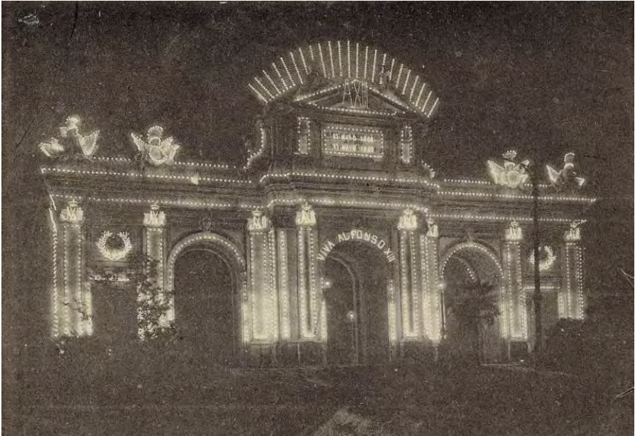
Foto 10. "Iluminación de la Puerta de Alcalá" (Inv. 2209/06/0025)