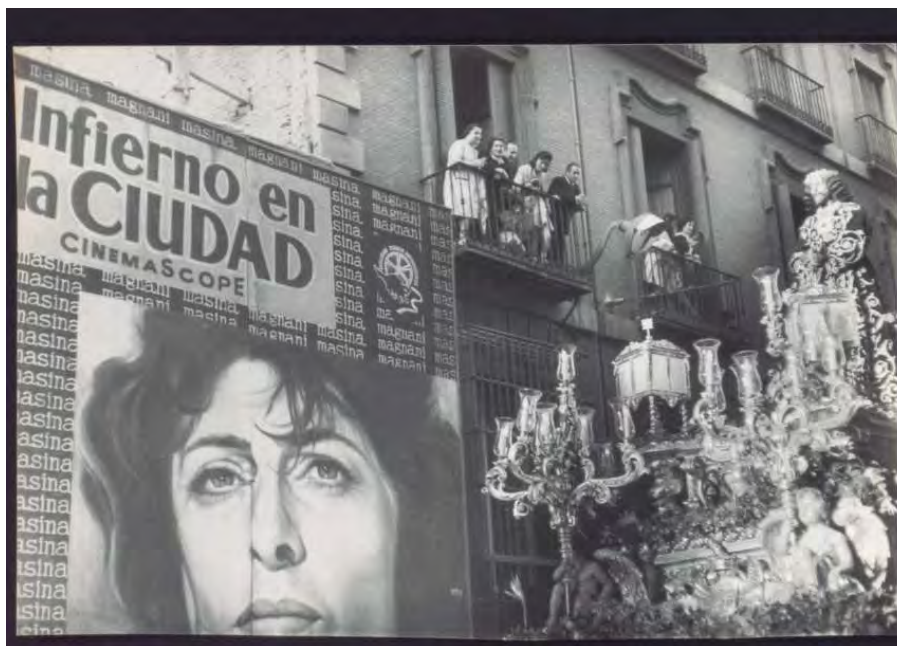
Foto 25. “La carrera de San Jerónimo y Jesús del Gran Poder”, Antonio Alcoba, 1959 (Inv. 2021/28/959)

Las fiestas y las celebraciones también son un motivo permanente en sus imágenes, especialmente procesiones, fiestas patronales, y fiestas de barrios.