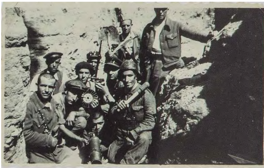
Foto 21. "Grupo de soldados republicanos", 1936-1937 (Inv. 2016/18/274)