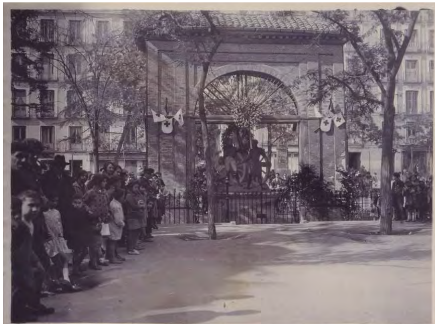
Foto 16. "Fiesta en el Arco de Monteleón" Servicio Fotográfico Municipal, 1930. (Inv. 00008.424)

Por último, habría que destacar de este Servicio, que fotografió muchas celebraciones populares de la ciudad. Tenemos fotografías de las fiestas y lugares relacionados con el patrón San Isidro, como imágenes de la fuente del Santo en 1928 u otras, como esta curiosa Fiesta de la Cruz Roja en el Arco de Monteleón, posiblemente coincidiendo con la fiesta del 2 de Mayo (foto 16).