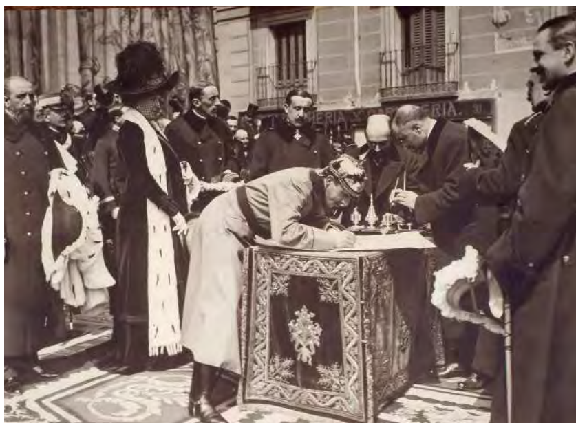
Foto 12. “Alfonso XIII firmando la inauguración de las obras de la Gran Vía”, Anónimo, 1910 (Inv. 00001.693)