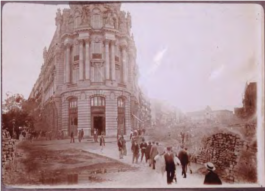
Foto 13. "Derribos para la construcción del primer tramo de la Gran Vía", ca. 1912 (Inv. 00009.630)