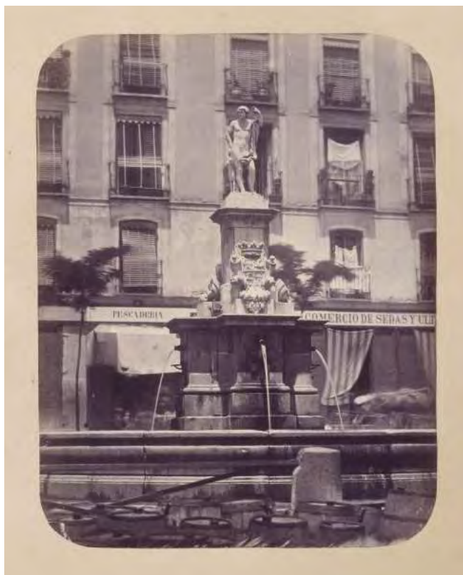
Foto 6. “Fuente vecinal en la Plaza de Lavapiés”, 1864 (Inv. 00021.986-48)