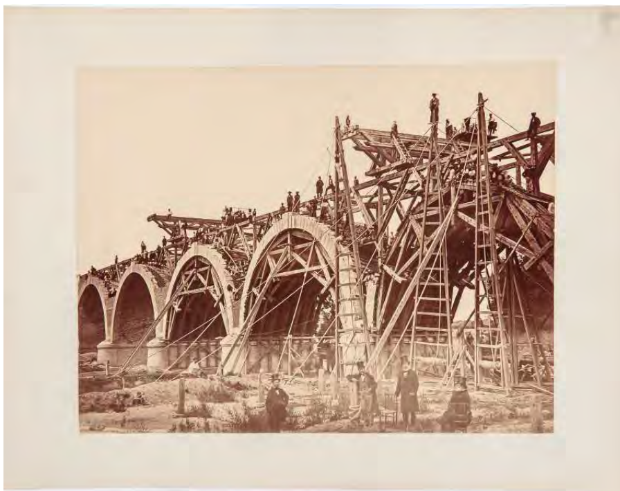
Foto 5. "Puente de los franceses", Charles Clifford, 1860 (Inv. 0005.244)

De igual modo, hay testimonios de otras obras de ingeniería en nuestra ciudad, tan importantes como la construcción del Puente de los Franceses en 1860, primer puente construido en Madrid para el paso del ferrocarril. En estas imágenes se nos muestran tanto las obras como los obreros e ingenieros, porque son imágenes que reflejan la vida cotidiana de los protagonistas de estos cambios. Esa es una de las principales características de Clifford: sus imágenes dan siempre sensación de estar realizadas de manera espontánea, sin una preparación, con intención de recoger el momento, la situación, los personajes... (foto 5).