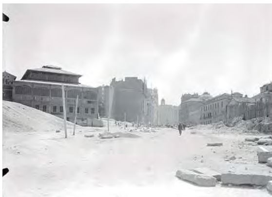
Foto 19. “Construcción del tercer tramo de la Gran Vía”, Gerardo Contreras Saldaña, 1929 (Inv. 00023173)