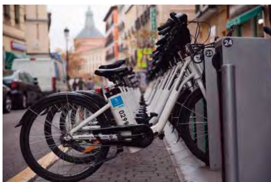
El Servicio de BiciMad (2014).