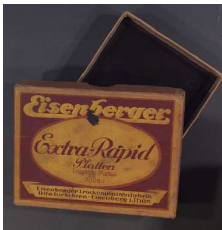
Antonio Prast. Cajas de negativos del Servicio Fotográfico Municipal

Ahora nos encontramos con los rastros que dejaron los fotógrafos en estos documentos en forma de pequeños agujeros en sus esquinas cuando hemos vuelto a ellos para digitalizarlos con medios modernos, lo cual es un recordatorio de la necesidad de extremar las precauciones para evitar dañarlos.