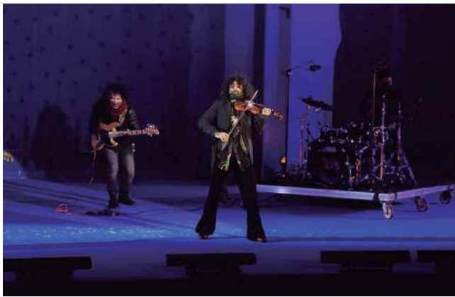
Concierto de Ara Malikian (2020).