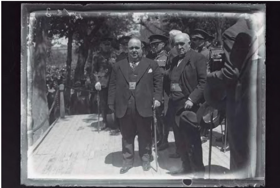
El Alcalde Pedro Rico (1931)_Servicio Fotográfico Municipal.

La Casa de Campo era, en 1931, un parque prácticamente desconocido para la inmensa mayoría de los madrileños, ya que solamente era posible pasear por sus caminos mediante una invitación de la Corona. Además, apenas había sido retratado más que parcialmente en algún reportaje de prensa con motivo de algún acto organizado en sus instalaciones con motivo de alguna visita de dignatarios extranjeros a la capital. Al tomar posesión de la finca, el Ayuntamiento se dio cuenta de que no estaba preparada para recibir una gran cantidad de visitantes por lo que, después de llevar a cabo un inventario de bienes presentes dentro de sus límites, llevó a cabo un ambicioso plan para adecuar las instalaciones a las nuevas necesidades del parque. Y en estos dos procesos estuvo presente el Servicio Fotográfico, retratando un parque con sus lagos, jardines, invernaderos, paseos, instalaciones deportivas, etc. Pero también descubrieron otro aspecto del parque más desconocido: el de finca productiva dedicada a usos agrarios y ganaderos. Aquí no faltaban granjas, eras, carpinterías, talleres y gran número de viviendas para los empleados del parque, que también disfrutaban de parroquia, escuela e, incluso, un cementerio propio.