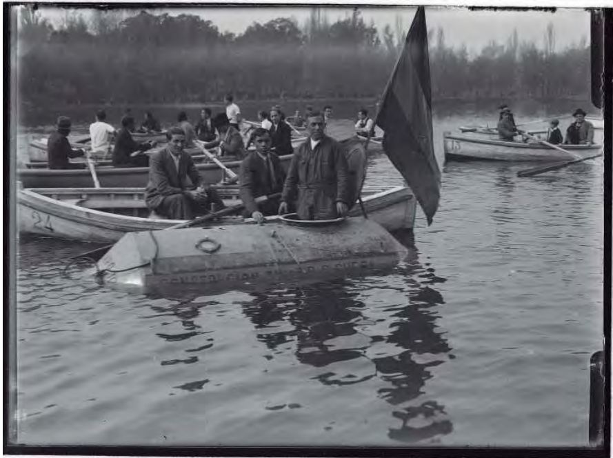
Un submarino en la Casa de Campo (1931).

Es un ejemplo nada más de lo que se puede encontrar en este fondo fotográfico, todavía pendiente de catalogar, fundamentalmente la parte descubierta en la Hemeroteca Municipal, y que próximamente estará accesible en nuestra página web.