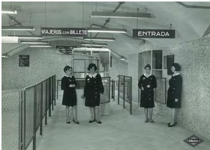
Personal de taquilla de Metro en la estación de Vista Alegre (1969).