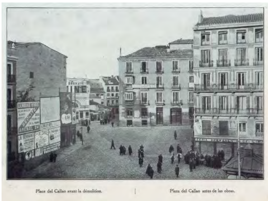
La plaza de Callao antes de su reforma por los trabajos de apertura de la Gran Vía (ca. 1920) Extraída de la monografía La Gran Vía (Biblioteca Histórica Municipal).