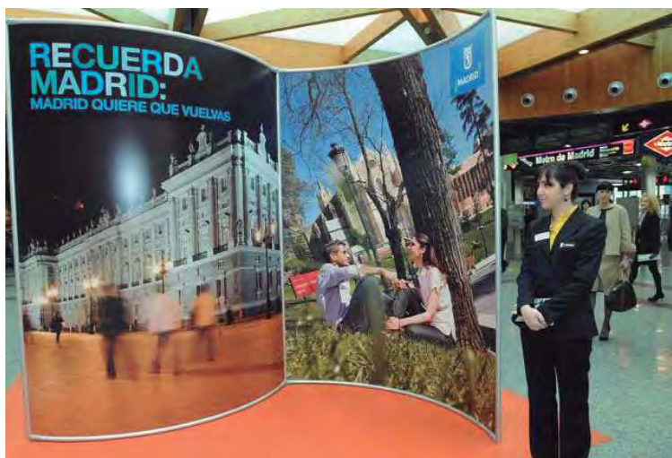
Recuerda Madrid. Madrid quiere que vuelvas (2010). Gabinete de prensa del Ayuntamiento de Madrid.

La gran trascendencia de este archivo que es testimonio de la vida municipal desde el año 2003 llevo a la Biblioteca Digital a asumir, en colaboración con la Dirección General de Comunicación, la ordenación y gestión de este archivo.