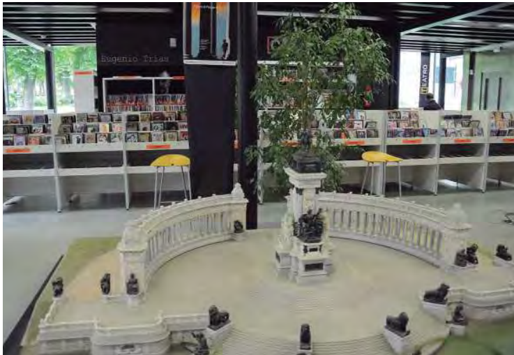
La Biblioteca Eugenio Trias en el Parque del Retiro (2013).