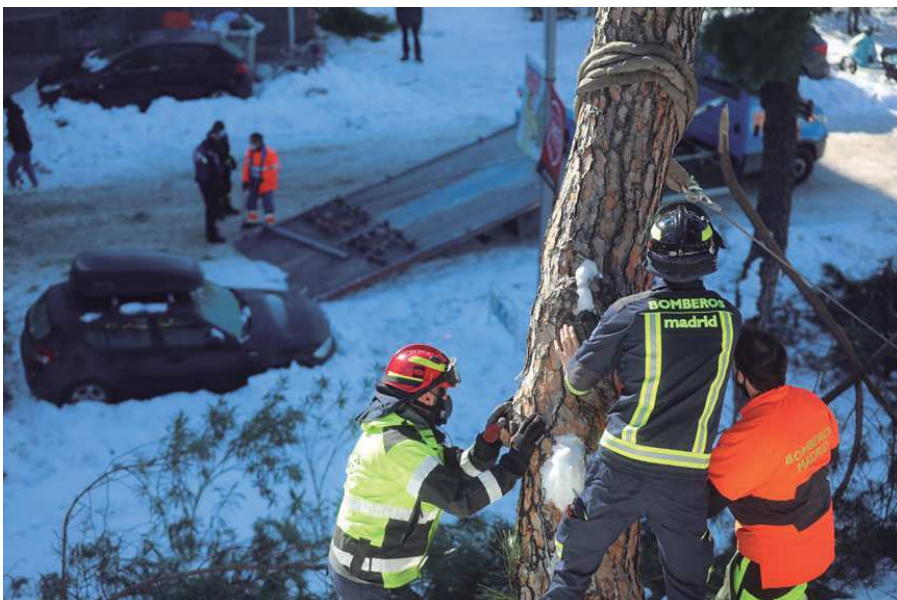
Los efectos de la Filomena (2021).

En la actualidad este fondo todavía no es accesible a través de la web, aunque sí está abierto a su consulta a cualquier persona que muestre interés en él, ya que se trata de un valiosísimo recurso para el estudio de la historia más reciente de la ciudad de Madrid.