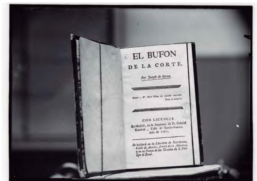
Reproducción de documentos históricos de la Hemeroteca Municipal. Servicio fotográfico Municipal ca. 1925)

Se pensó en un primer momento que la autoría de la colección procedía de la mano de José María Díaz Casariego, cuya historia merece ser contada, aunque nos salgamos un poco del tema que nos congrega. Casariego era uno de los fotógrafos más importantes del periodismo español de los años 20. Trabajó para las más famosas revistas, como Nuevo Mundo o Esfera, e incluso fue uno de los fundadores de la revista Mundo Gráfico. Acompañó al ejército español durante la Guerra de África, lo cual le proporcionó una enorme fama y prestigio al conseguir fotografiar a Abd el-Krim y al líder rifeño Raisuni. En definitiva, junto a Campúa, Alfonso y Marín, forma parte de la elite del fotoreporterismo en la edad de oro de la prensa española. Aunque su figura puede que no haya tenido la trascendencia pública de sus tres compañeros, lo cual se explica por su propia biografía y por su compromiso político.