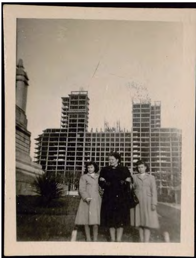
Posando ante el Edificio España en construcción (ca. 1951). Documento compartido por la familia Díez Domínguez.

trascender del documento fotográfico y abrirse a todo tipo de documento que pueda hablar de su evolución y de las personas que los habitaron. Son decenas de fotografías que nos muestran una vida de barrio muy reivindicativa, de gente que se moviliza por conseguir infraestructuras en unos barrios que todavía no habían llegado a alcanzar todos los servicios que probablemente deberían haber tenido ya en ese momento, ya que la queja general que se detecta a partir del contacto con todas estas asociaciones es la del abandono por parte de las instituciones.