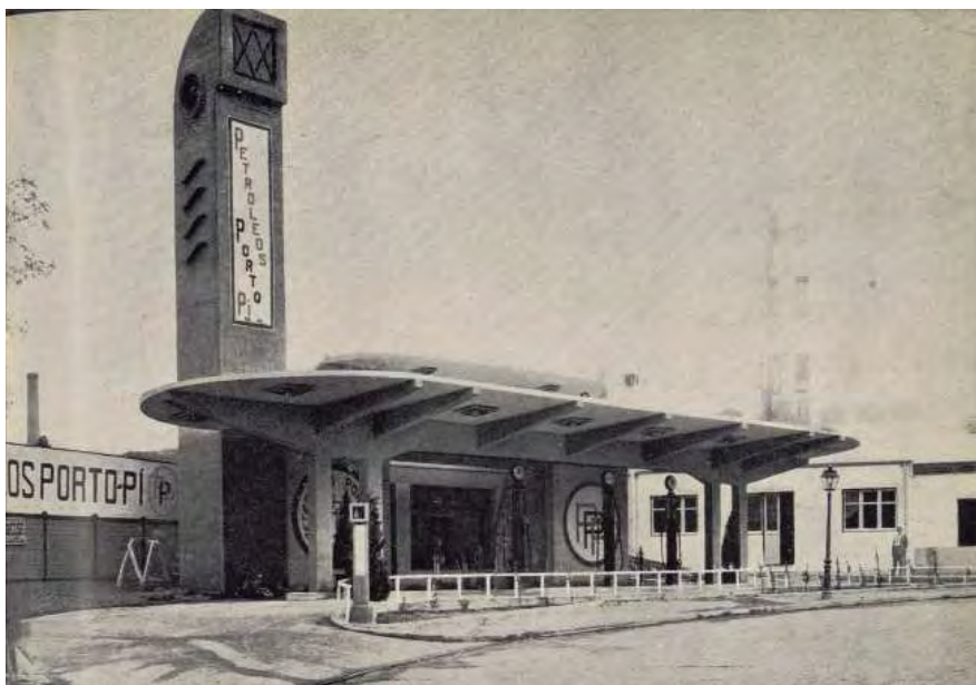
Gasolinera Porto Pi (1939.