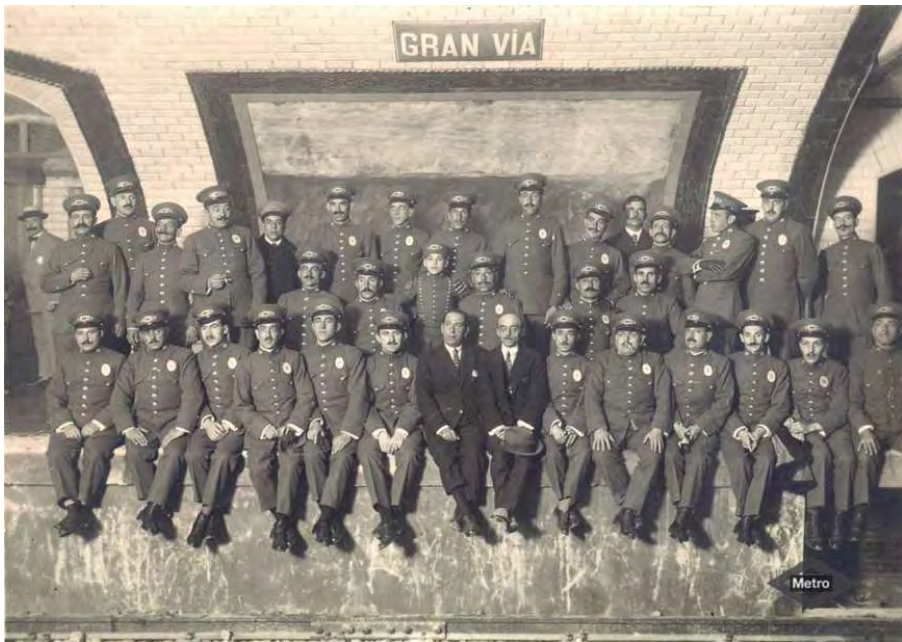
Personal de Metro de Madrid en la estación de Gran Vía (1919).

Fruto de este convenio, la Biblioteca abordó la construcción de una web con una selección de las 1.600 imágenes más interesantes y representativas que recuperan los 100 primeros años de Metro de Madrid. Campañas publicitarias, obras, inauguraciones, estaciones, modelos de trenes son algunas de las imágenes que nos permiten acercarnos a la historia del metro de nuestra ciudad. En la actualidad todo el fondo es accesible en la Biblioteca Digital, dónde se garantiza, no solo su consulta, sino su preservación a largo plazo.