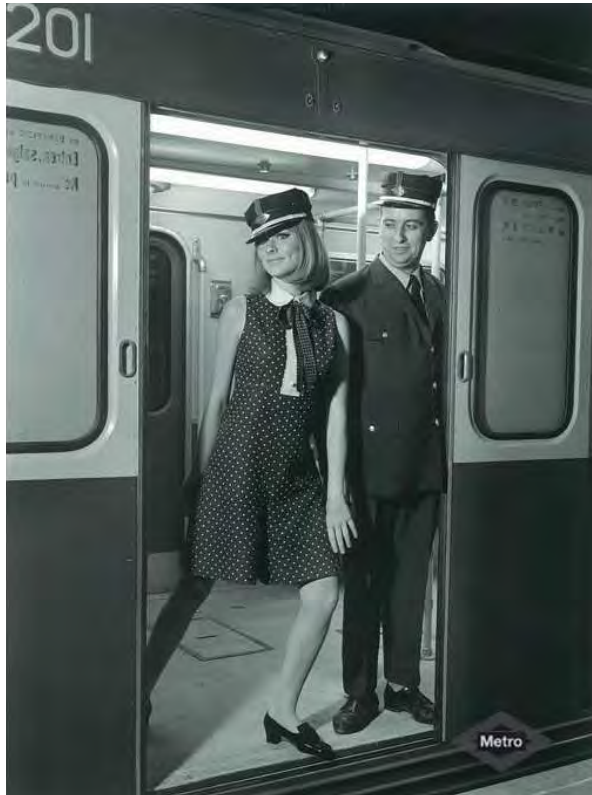
Campaña publicitario de Metro de Madrid (1969).