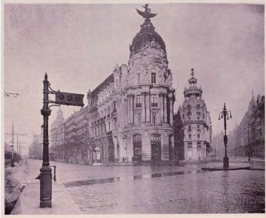
El primer semáforo de Madrid (1926).

A. Ciarán. El palacio de la duquesa de Sevillano (ca. 1905).