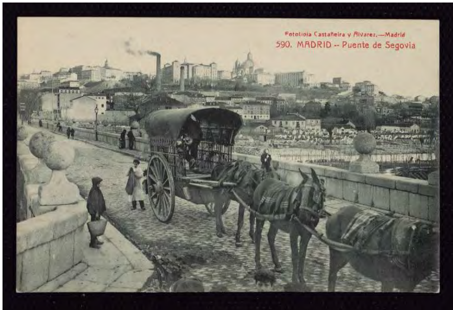
El puente de Segovia. Tarjeta Postal (Museo de Historia, inv. 1991/1/939).

No quisiéramos apuntar otra línea de trabajo a partir de las ilustraciones presentes en el fondo documental de la Hemeroteca Municipal datado a partir de la segunda mitad del siglo XIX cuando las técnicas de impresión no permitían reproducir a satisfacción las primeras fotografías salidas de las cámaras de los pioneros de este nuevo arte y tenían que reproducirse en forma de grabado. Son muy frecuentes en la principal revista ilustrada de esta época La Ilustración Española y Americana y suelen acompañarse de la leyenda “a partir de una fotografía”. Fotografías que muchas veces no eran realizadas por fotógrafos cualquiera sino de artistas como Jean Laurent.