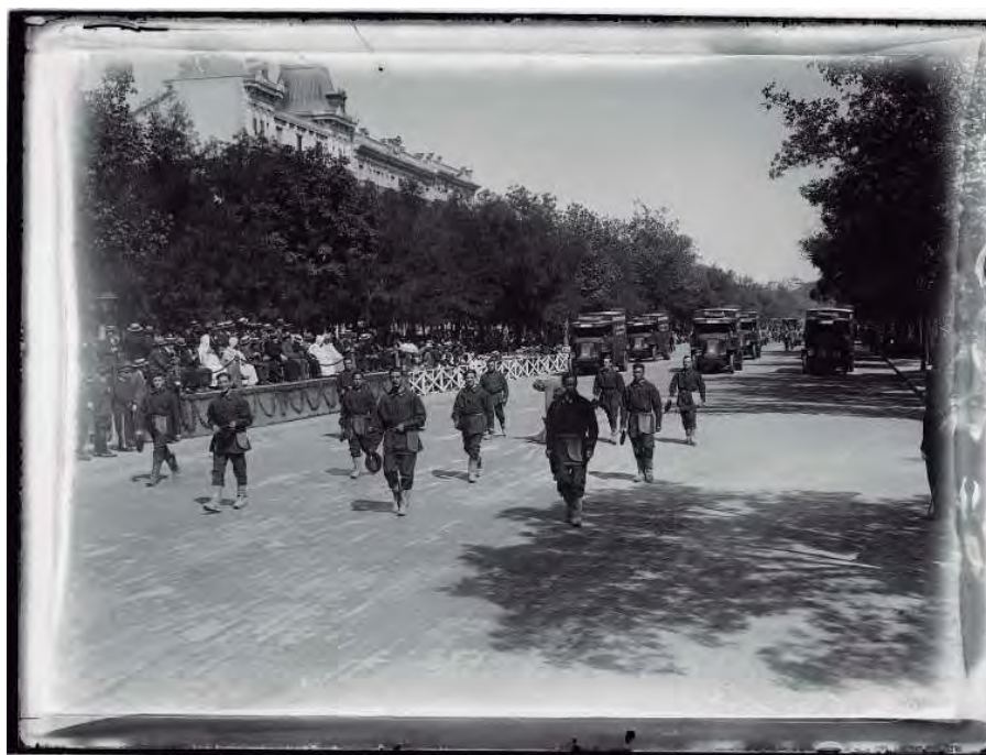
Desfile de los Servicio Municipales (1) (1928).

Los desfiles, adecuadamente documentados por el Servicio Fotográfico Municipal, se realizaron el 18 de octubre de 1925, con motivo de la celebración del 1º Congreso Nacional Municipalista y después el 14 de septiembre de 1928, aprovechando una reunión de autoridades provinciales a la que acudieron incluso representantes de las colonias africanas.