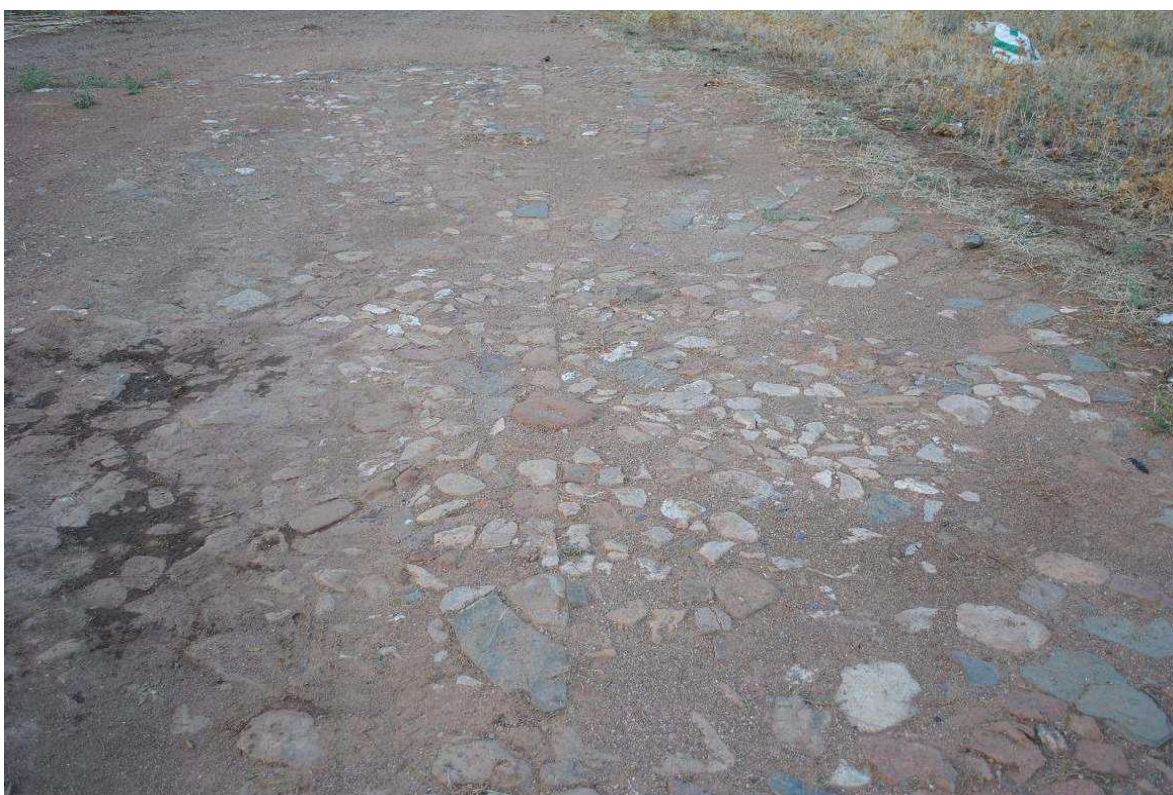
Era en el ejido de la aldea de El Acebuchar. Autor: Félix Sánchez Fernández, 2010.

Conforme nos alejamos del casco urbano podemos encontrar en el ejido algunas eras, testigos del pasado agrícola de la población que servían para trillar los cereales. El paisaje de dehesa, tan común en las Nuevas Poblaciones de Sierra Morena, y el olivar, todavía muestran la estructura de las suertes de los colonos, que enmarcadas por multitud de caminos, los que aquí se conocen como “líneas”, nos llevan a otras aldeas coloniales cercanas como La Mesa de Carboneros, Martín Malo en Guarromán o La Fernandina en La Carolina.