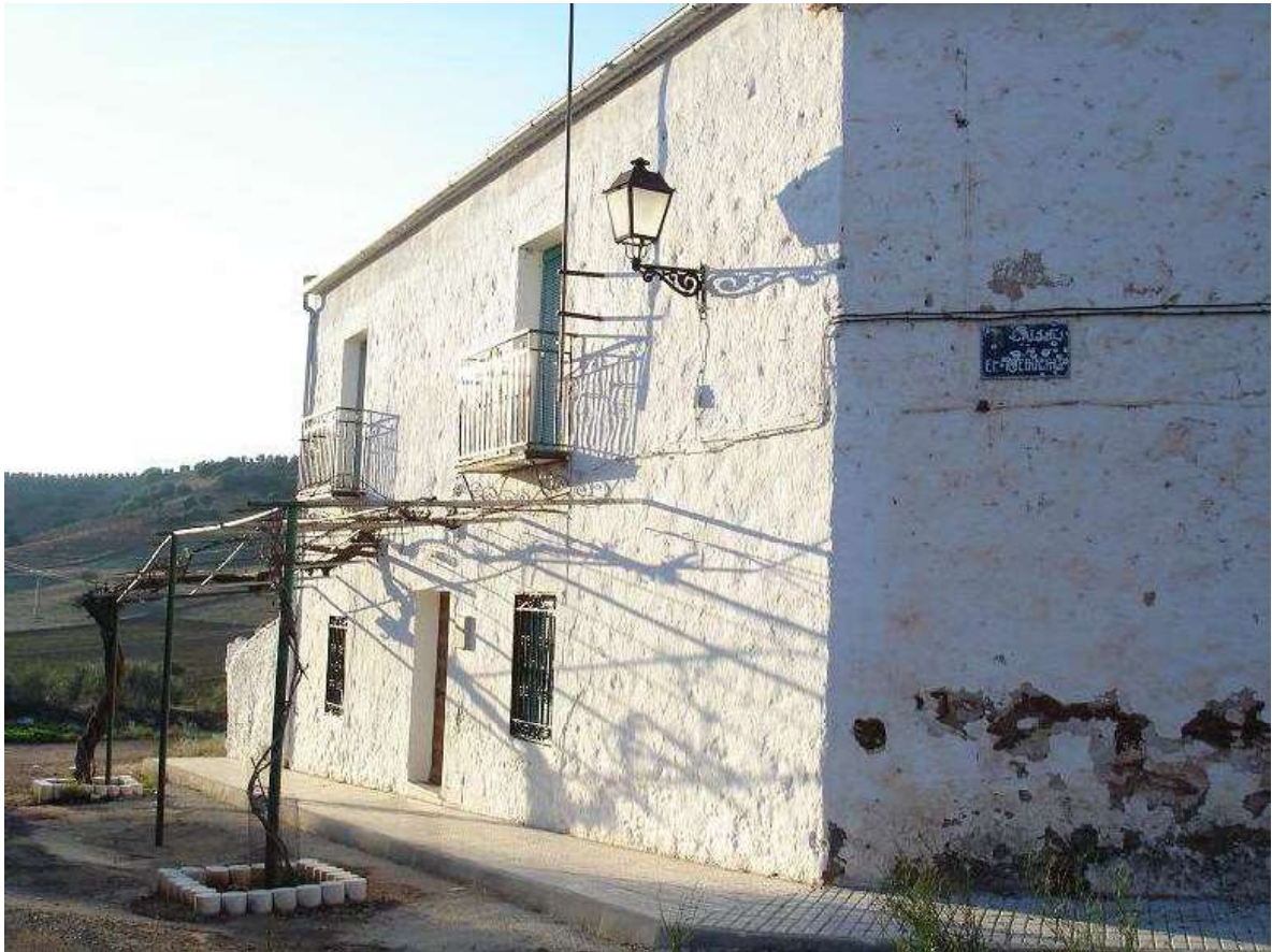
Casa de colonos de la aldea de El Acebuchar formando chaflán.

Las casas coloniales que todavía se conservan en la aldea son las típicas de la colonización carolina de Sierra Morena y particularmente de los modelos utilizados en otros núcleos rurales. Se conservan practicante todas las casas de colonos, y algunas de ellas con pocas reformas. Son sencillas, de dos plantas, con la puerta flanqueada por dos ventanas simétricas. En la planta superior también encontramos dos vanos, que junto con la poca altura de este piso ayudaba a emplearlo como cámara que se utilizaba para almacenar cereal y aperos (Sánchez 1996: 257).