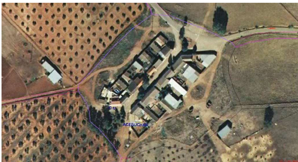
Vista aérea. Aldea el Acebuchar. Oficina virtual del Catastro. 2009. (Sánchez-Batalla 2011: 78).

La feligresía de Carboneros, realizada dentro de los planes de ampliación de las colonias llevados a cabo durante el año 1768 quedó constituida finalmente por Carboneros, su capital, y cuatro aldeas: La Escolástica, Los Cuellos, La Mesa y El Acebuchar. De entre todos estos núcleos, queremos acercarnos por medio de este artículo a la aldea de El Acebuchar, una pequeña joya urbanística dentro de las Nuevas Poblaciones.