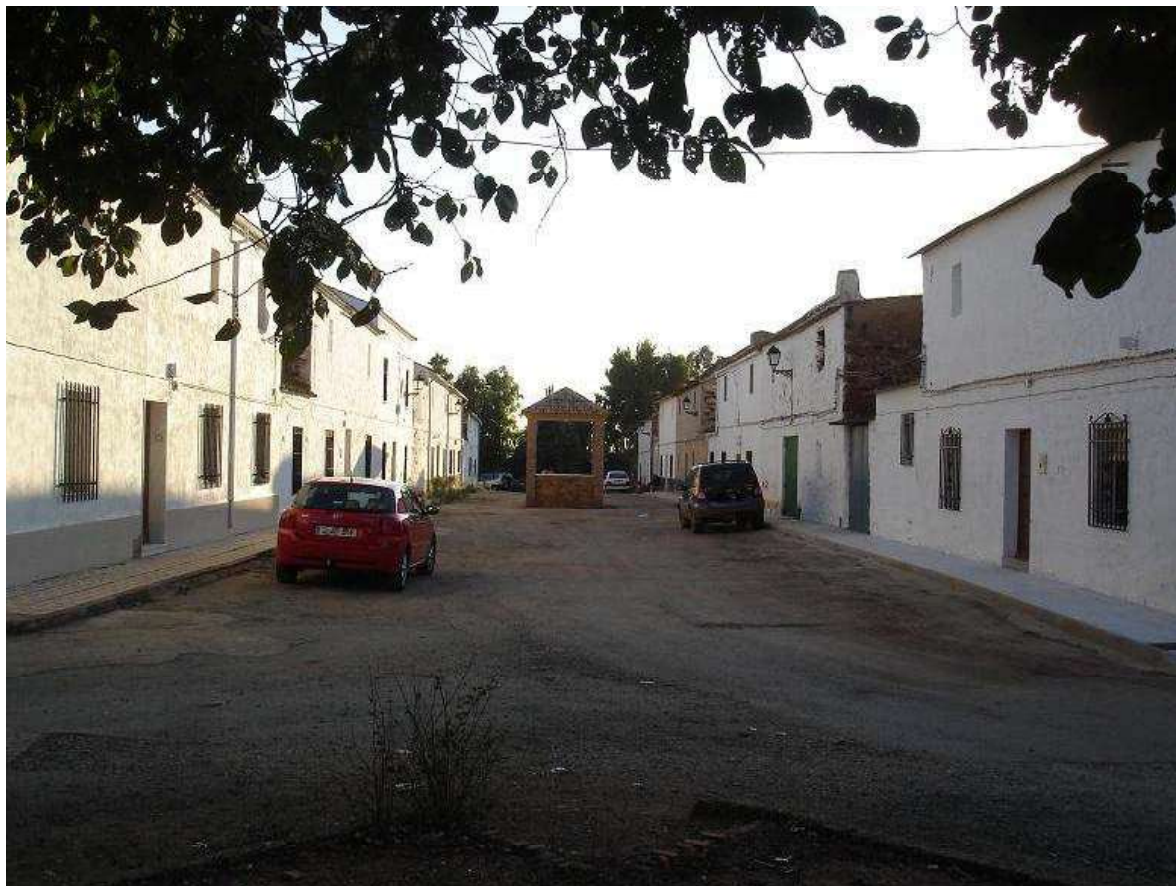
Calle principal de la aldea de El Acebuchar con el altar de obra realizado para colocar a San Isidro Labrador.

Abandonando la A4, antiguo Camino Real de Andalucía, a la altura de la colonia de Carboneros 1 , tomamos la carretera JA-6102, que nos conduce directamente a la aldea de El Acebuchar.