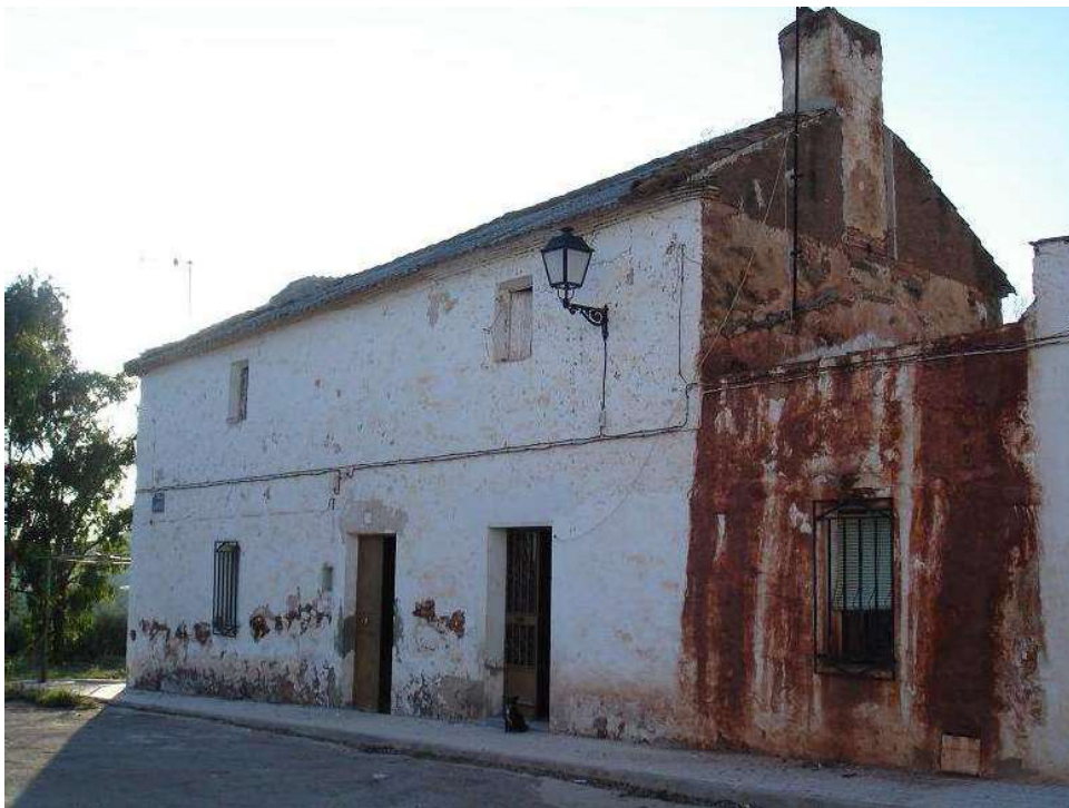
Casa de colonos de la aldea de El Acebuchar con puerta delantera para entrar al corral convertida en una ventana.