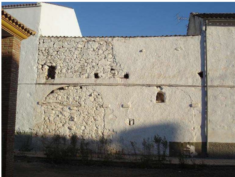
Detalle de los arcos cegados que eran las puertas delanteras para entrar al corral.

Las casas de la aldea poseen una entrada frontal para los animales que daba acceso al corral sin necesidad de atravesar la vivienda, que estaba conformado por un gran portón adintelado mediante un arco elíptico que arrancaba en un pequeño filete a modo de collarín sobre las jambas. La puerta, de dos hojas, estaba abisagrada mediante el empotramiento de la prolongación de los goznes en el suelo y en un segundo dintel recto por el interior del arco (Sánchez 1996: 262). Algunas casas presentan cegadas estas puertas de corral, dejándose entrever el arco. Los materiales constructivos solían ser en el mejor de los casos piedra de distintos tamaños y ladrillos, que se encalaban una vez concluida la fachada. La techumbre se realizaba con una estructura de madera a tres aguas 2 que posteriormente se cubría con tablas encima de las cuales se situaba teja árabe de barro.