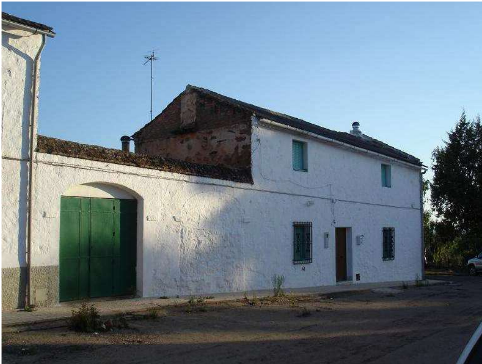
Casa de colonos de la aldea de El Acebuchar con puerta delantera para entrar al corral. Foto: F. J. Pérez Fernández, 2010.