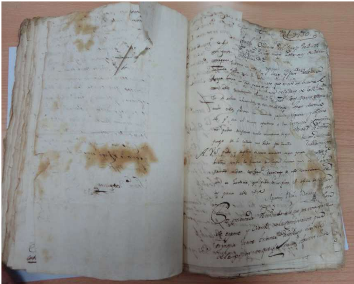
Expediente de la escribanía deteriorado y manchado como consecuencia de la Guerra de Independencia.

Como resultado directo de la Guerra de Independencia, la pérdida de documentación fue enorme para las colonias. Pero por desgracia, la sangría documental no se detuvo con la Guerra de Independencia. Con el fin del Fuero de Población en 1835, y las idas y venidas del archivo de la Intendencia de Nuevas Poblaciones a Jaén no ayudo a su conservación. En el siglo XX, la Guerra Civil Española golpeo tanto a los archivos eclesiásticos de la alguna de las parroquias de las colonias como a archivos civiles. Posteriormente, durante la segunda mitad del siglo XX, por el desconocimiento o desidia de algunas autoridades, también se ha perdido un importante volumen de documentación en las Nuevas Poblaciones difícilmente recuperable.