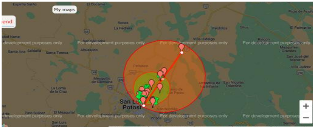
Perfil geográfico 2021-2022