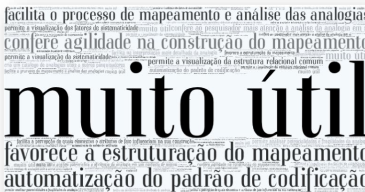
Figura 7. Utilidade do MAPES nos contextos de ensino e de pesquisa, segundo os participantes.

Por fim, os participantes foram questionados se consideravam o MAPES uma ferramenta útil para os estudos de analogias. Na análise das respostas encontrou-se que, para os professores pesquisadores, o MAPES é uma ferramenta muito útil, como evidencia a nuvem de palavras da figura 7 a seguir: