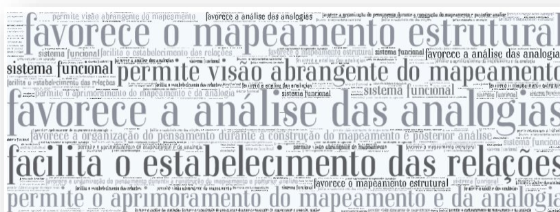
Figura 5. Pontos positivos percebidos no MAPES pelos participantes.

Além das questões de múltipla escolha, foi solicitado aos participantes que descrevessem os pontos positivos percebidos no MAPES, as dificuldades no processo de mapeamento que poderiam interferir no seu manuseio e sobre a sua utilidade nas rotinas de trabalho dos pesquisadores em suas pesquisas com analogias. Ao realizar uma análise de conteúdo das respostas dos professores pesquisadores, foram identificadas algumas informações que, a seguir, são apresentadas sob a forma de nuvem de palavras. A figura 5 apresenta os seguintes pontos positivos sobre o MAPES elencados pelos participantes: