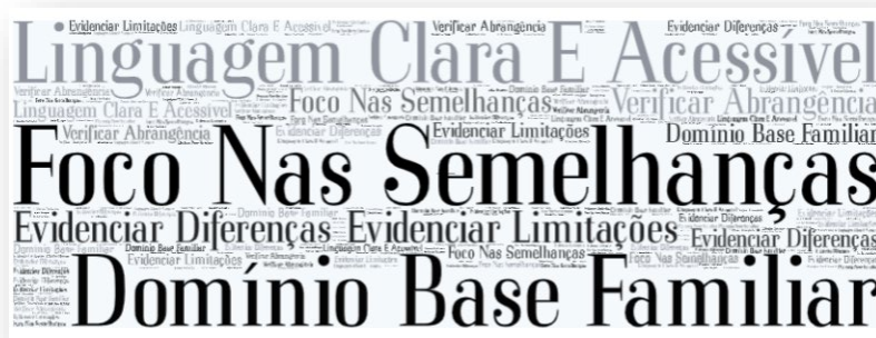
Figura 4. Aspectos relevantes no uso de analogias em sala de aula segundo os participantes da pesquisa.