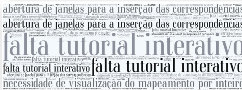
Figura 6. Dificuldades percebidas com o uso do MAPES pelos participantes.