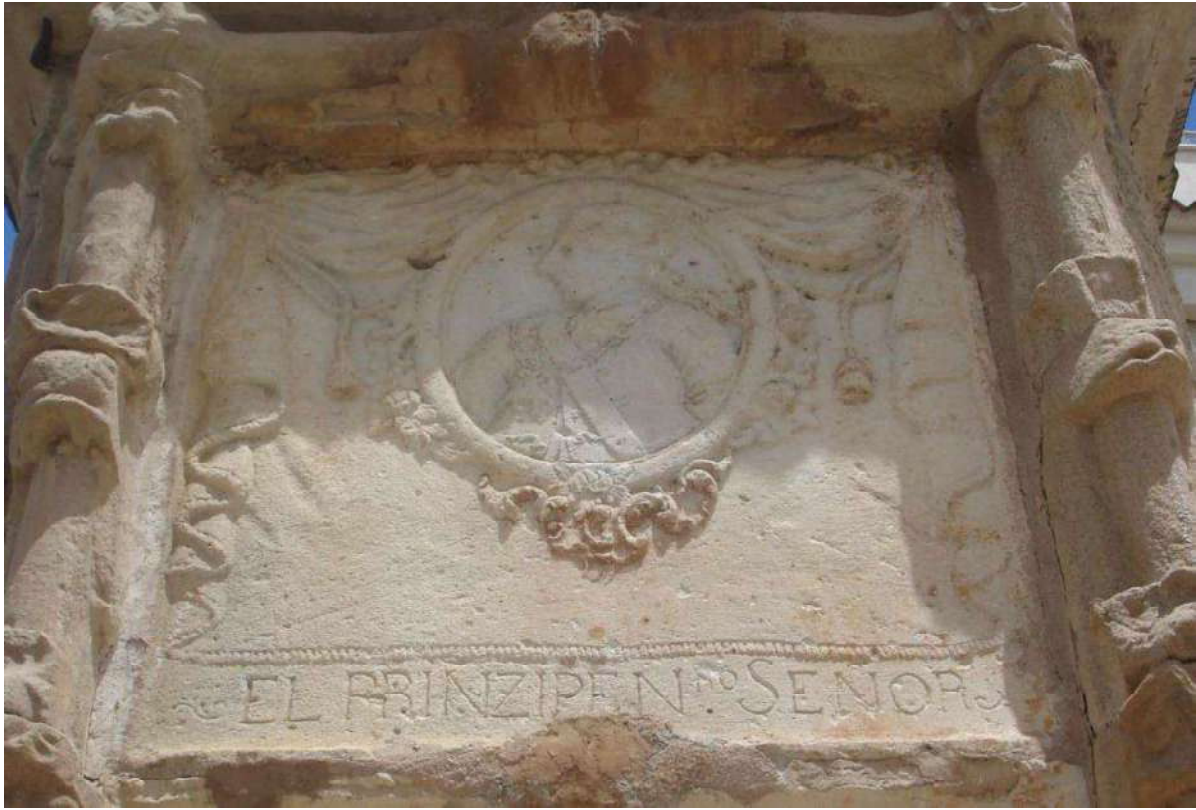
Príncipe Carlos, futuro Carlos IV.