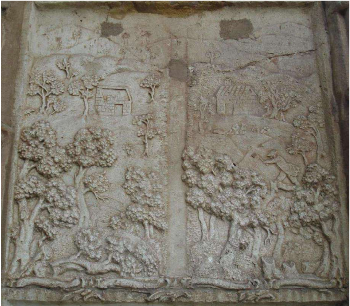
Dos suertes con casas de dotación y colono rozando el monte de su suerte en Sierra Morena.