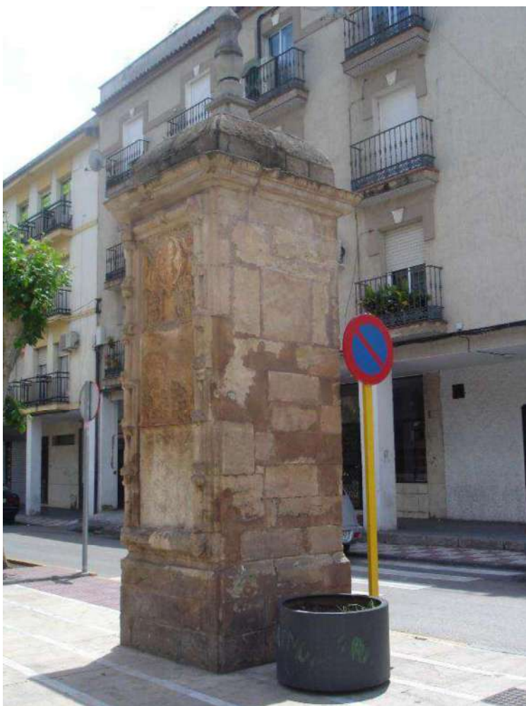
Columna de la fundación del rey Carlos III en La Carolina.

Las dos imágenes inferiores muestran escenas de colonos y colonas, enmarcadas en dos suertes. El primer relieve representa dos de estas parcelaciones; una sin limpiar, en la que se está construyendo una casa de dotación; en la otra vemos a un colono que roza sus tierras con su casa ya construida al fondo y un pequeño campo cultivado. En el relieve de la segunda columna encontramos también sendas suertes, en las que multitud de mujeres, niños y animales se sitúan en torno a pozos, albercas y canales, en clara alusión a la captación de aguas como inicio de la vida en las Nuevas Poblaciones publicitando el éxito de las colonias con esta escena. Una estampa de caza completa el paisaje.