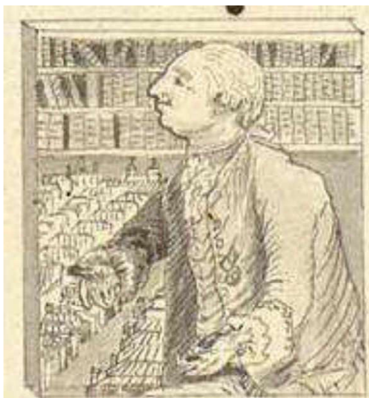
Retrato del superintendente Pablo de Olavide ofreciendo las Nuevas Poblaciones a Carlos III, 1769. Detalle de la Perspectiva de la entrada de La Peñuela, capital de las Nuevas Poblaciones de Sierra Morena.

En 1769, el visitador Pedro Joseph Pérez-Valiente no vio oportuna por razones de decoro la colocación de la imagen de la Inmaculada en la plaza de los Mesones, sustituyéndola por la efigie del príncipe Carlos, y trasladando el relieve mariano a la portada de la parroquia. Los paneles con las inscripciones quedaron vacíos.