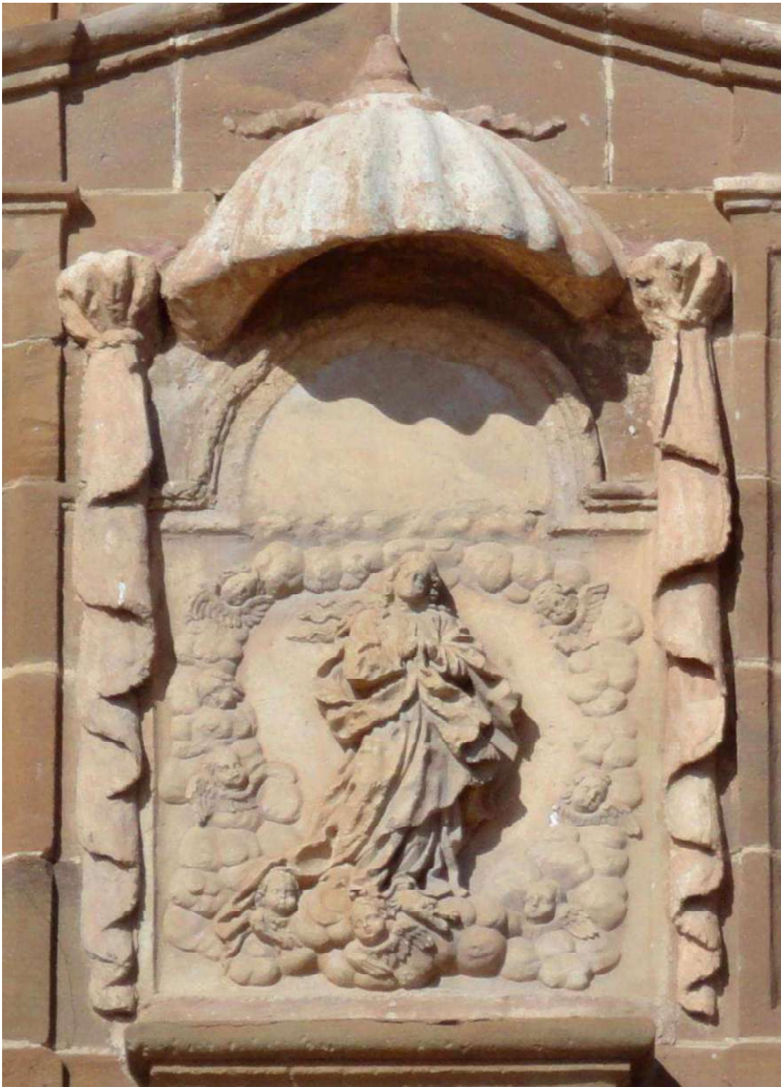
Relieve de la Inmaculada Concepción realizado para las columnas de la fundación trasladado en 1769 a la fachada de la parroquia de la Purísima de La Carolina.