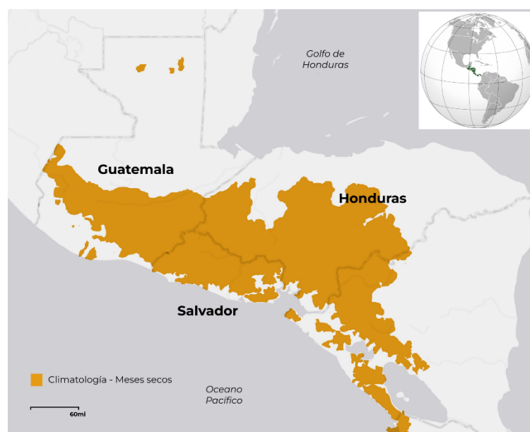
Figura 1. Corredor Seco, Triángulo Norte de Centroamérica