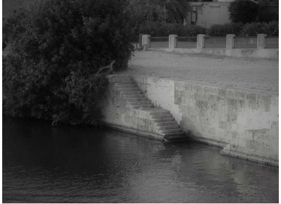
«¡Quién dirá que el agua lleva / un fuego fatuo de gritos!». Federico García Lorca (1921-1930): «Baladilla de los tres ríos», en Poema del cante jondo.