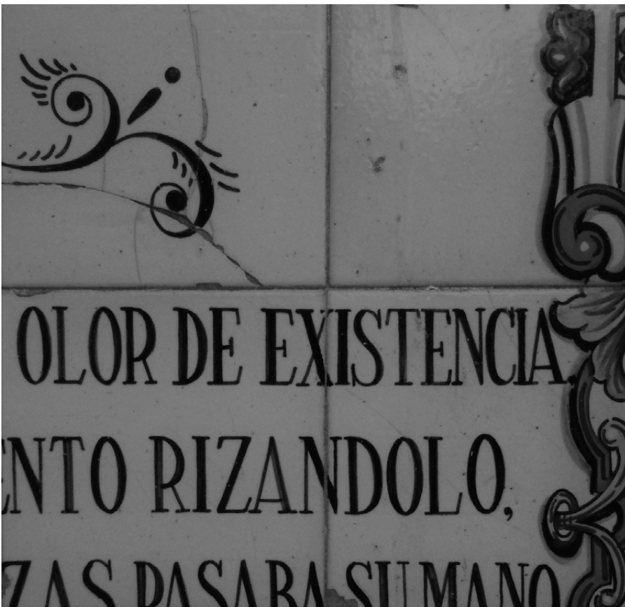
«Y había olor de existencia. / Un olor a gran sol descubierto [...]». Vicente Aleixandre (1944-1953): «En la plaza», en Historia del corazón .