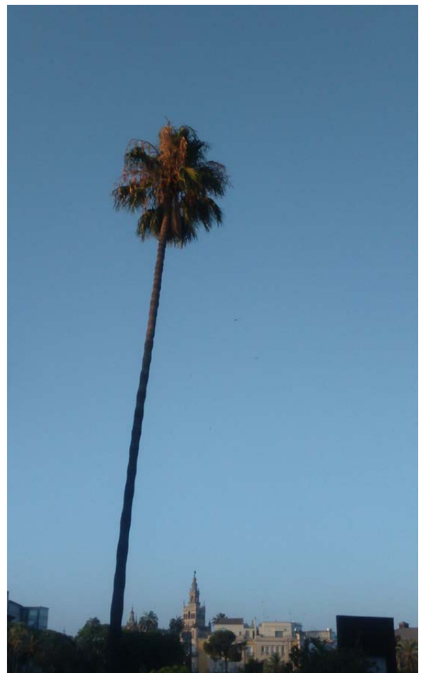
«A la luz pavorosa y amarilla / una sombra imponente se incorpora». Gerardo Diego (1963): «A Juan Belmonte (Boceto para una oda)», en La suerte o la muerte. Poema del toreo.