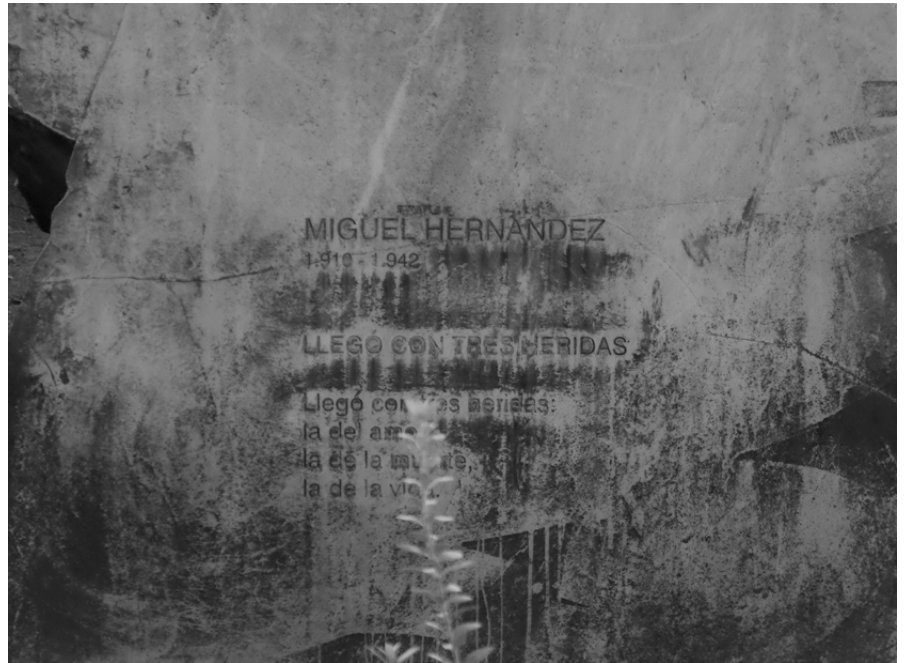
«Llegó con tres heridas: / la del amor, / la de la muerte, / la de la vida». Miguel Hernández (1958): Cancionero y romancero de ausencias.