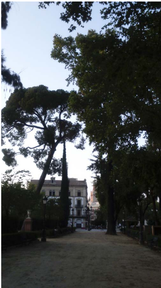
«Ingrávido presente. / Las ramas abren trémulas». Luis Cernuda (1924-1927): Primeras poesías.