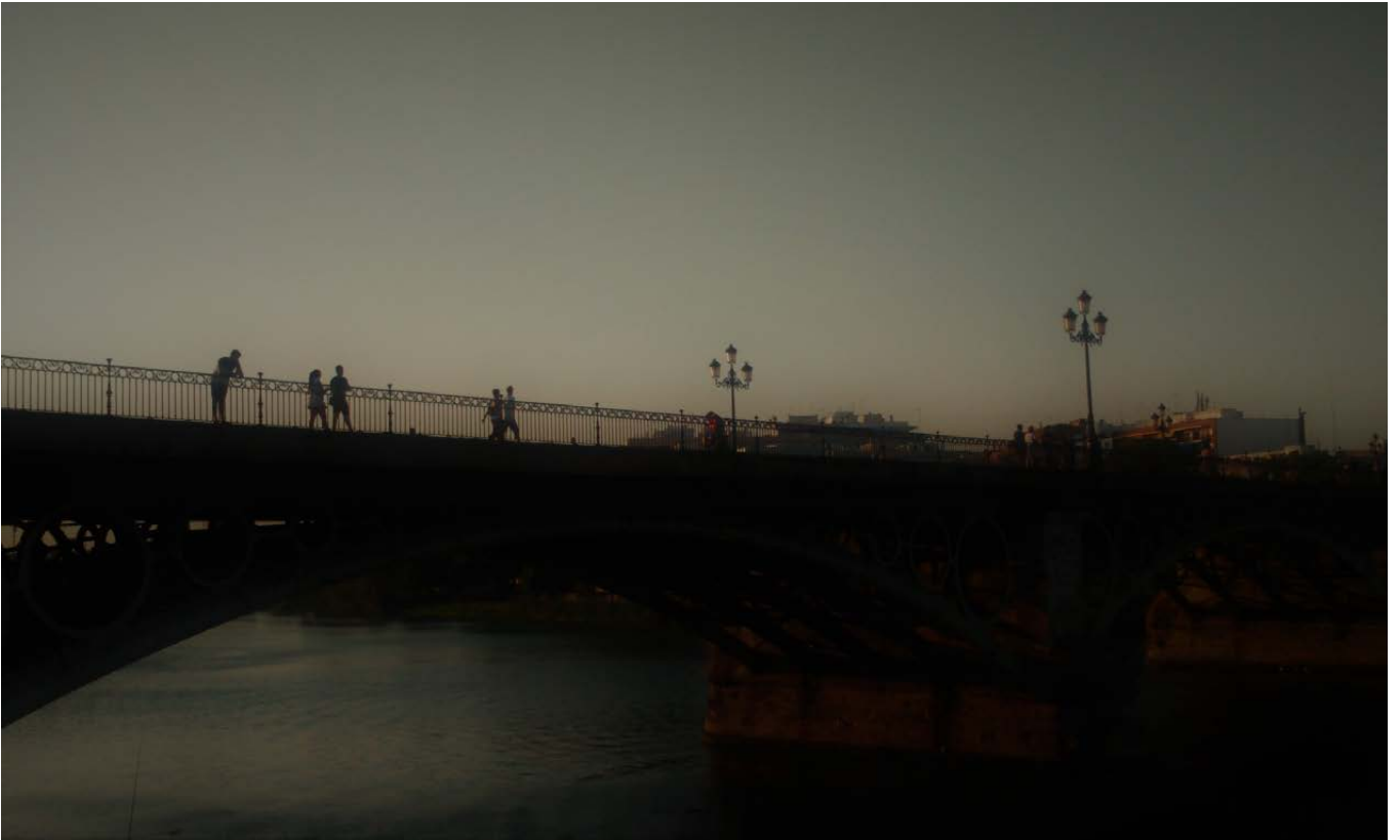
«Ir al atardecer junto al río de agua luminosa y tranquila [...]». Luis Cernuda (1940-1963): Ocnos.