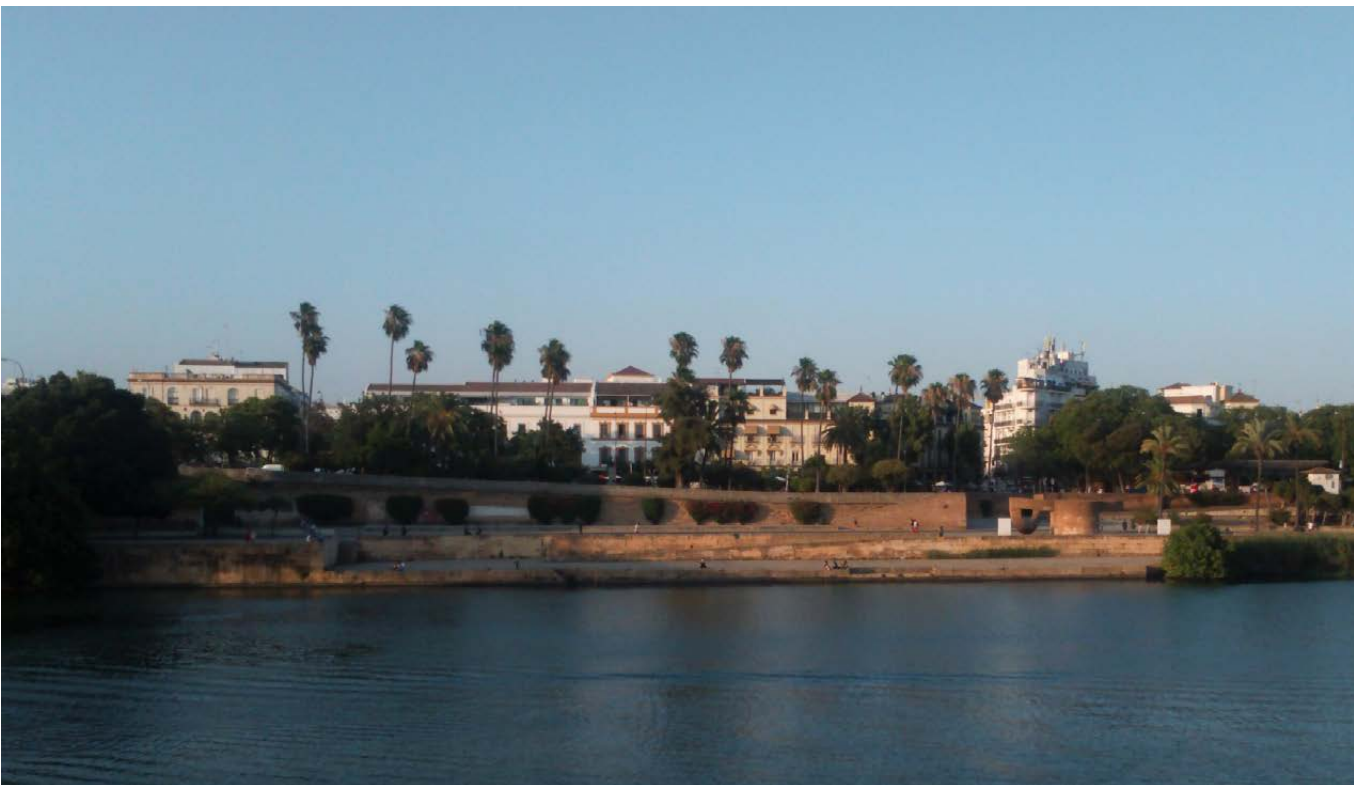
«La ciudad no se definía, lejos, depurada y distinta, sino que vivía, cerca, complicadísima [...]». Pedro Salinas (1926): «Entrada en Sevilla», en Víspera del gozo.