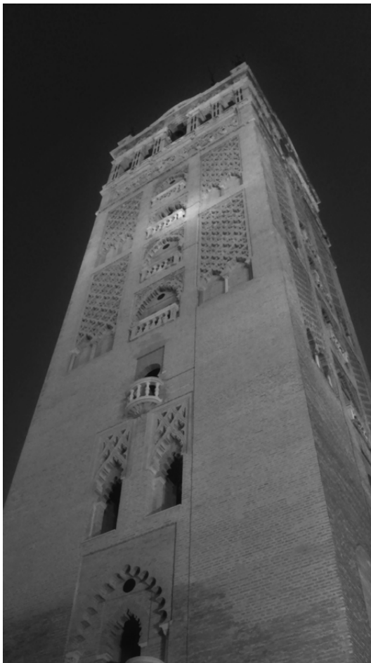
«Al contraluz de luna limonera / tu arista es el bisel, hoja barbera / que su más bella vertical depura». Gerardo Diego (1941): «Giralda», en Alondra de verdad.