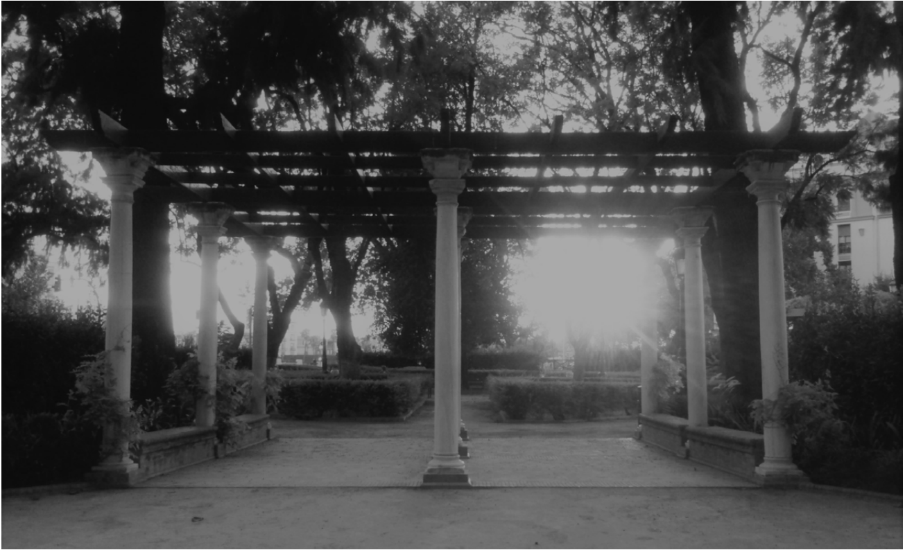
«Visible el entusiasmo / diluido en la luz, en el ambiente / de fervor y amistad». Jorge Guillén (1966-1972): «Unos amigos (Diciembre de 1927)», en Y otros poemas .