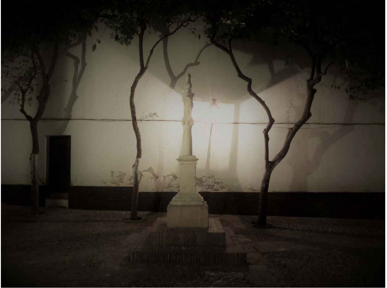
«Su dardeante quietud alaba una realidad que tiene nombre propio». Vicente Aleixandre (1957): «El verano de Sevilla», en Cartas a revistas de poesía .