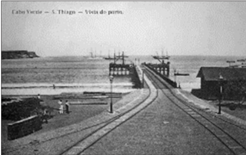
Santiago-Porto da Praia.

sofridos nas roças. « Em todos esses ultimos annos de crise, nas epochas mais difficeis, de julho a setembro, as encomendas remettidas d'America do Norte suavisaram immenso a falta ». (v. S.G.G. CX. 449 e R.P.S.A.C. CX. n.º 128).