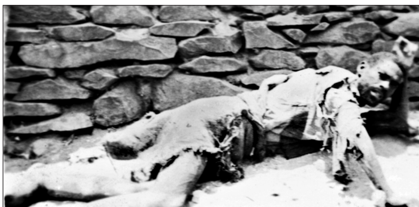
Habitantes de S. Vicente e Fogo (fome de 1942).