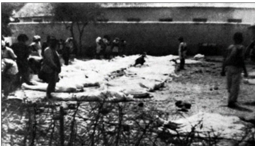
Vítimas do «Desastre da Assistência» na cidade da Praia, em 20 de fevereiro de 1949. Fonte: Carreira (1984), pp. 221-224.