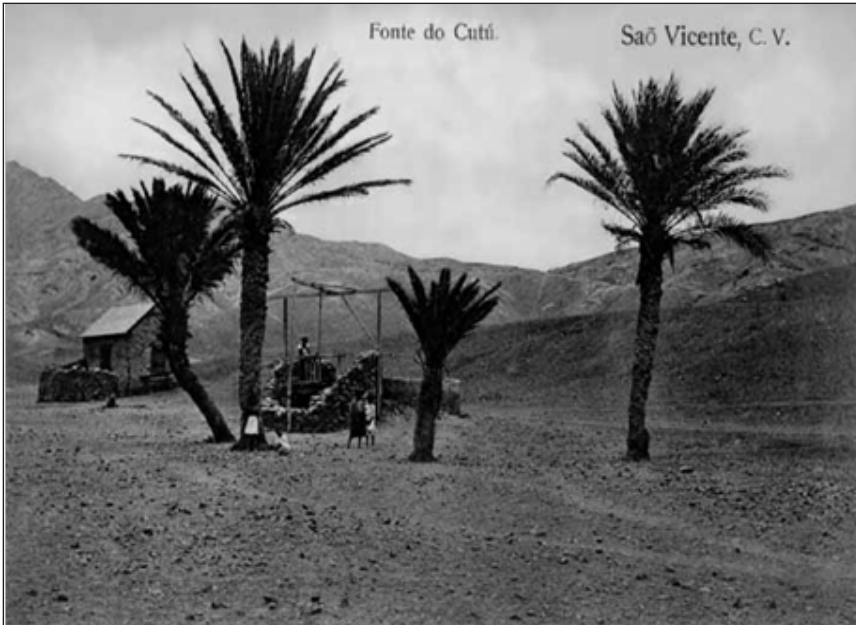
Fonte do Cutú, S. Vicente IAHN (Museu de Documentos Especiais). Álbum de Postais n.º 1.

quente aquisição do indispensável para o sustento da população, era igualmente uma das causas das fomes em Cabo Verde.