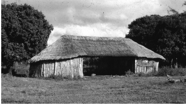
Figura 2: Vivienda rural tipo culata jovai en el Guairá (1982), donde aún se aprecia parte de la tierra del estaqueo.