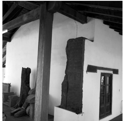
Figura 4: Muro de tipo "tapia a la vista" en San Ignacio Guasú.