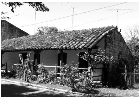
Figura 5: Vivienda en Caapucú, defendida por un muro "cáscara" exterior.