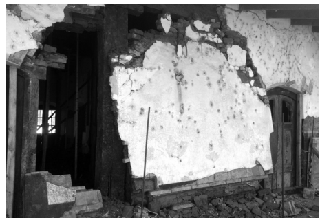
Figura 6: Uno de los muros desplomados por efecto del reblandecimiento de las hiladas inferiores.