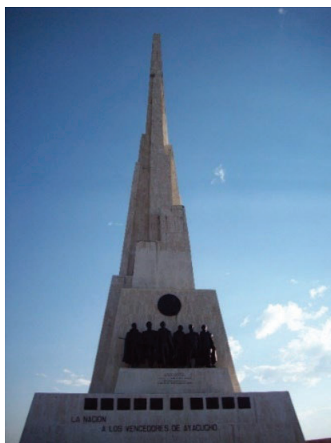
Figura 4. Obelisco (1974) del campo de batalla de Ayacucho en la pampa de la Quinoa. 35

obra del sesquicentenario, no existe un mapa de la batalla, lo que ha llevado a que los visitantes se vayan sin entender o sean sometidos a distintas interpretaciones de la batalla, resultado de las versiones académicas sobre este hecho de armas, que son interpretadas por los guías del sitio y la unidad de ceremonial histórico de la Gobernación de Boyacá, que inauguró en 2022 una burocrática oficina en el campo.