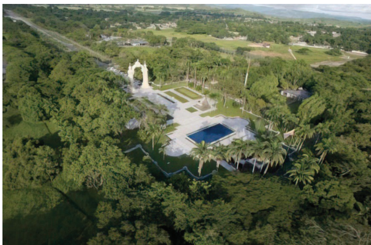
Figura 5. Campo de Carabobo. 37

obelisco, primando el área del puente en donde se desarrolló la batalla entre las vanguardias, alterando con ello la interpretación de la batalla de Boyacá. 36