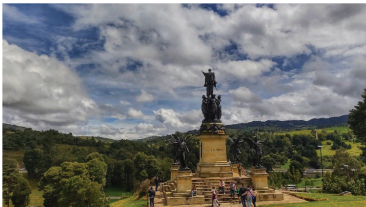
Figura 7: Monumento del Triunfo de Bolívar en el campo de Boyacá (1930) de Von Miller. 39

Sobre ellas, levantado sobre un escudo, a la manera de los antiguos triunfos romanos, se alza el general Bolívar con la bandera al pecho. A los pies, la hija de Zeus y la diosa de la memoria, Mnemósine , la divina Clío, la musa de la Historia, se apresta a escribir una página gloriosa de la historia, de la historia patria se entiende (Figura 7).