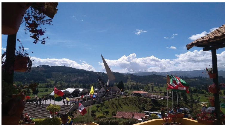
Figura 2. Bicentenario en el campo de batalla del pantano de Vargas. 30

el estado-nación de Colombia, Venezuela, Ecuador y Perú y sus héroes pudieran ser celebrados, inaugurando así el ciclo de las historias nacionales en América Latina, en especial en la América Meridional, en donde estos tendrían tanta importancia a lo largo de doscientos años, como lugares en los que se transmitían los valores patrióticos como el heroísmo, el culto a los padres de la Patria y el homenaje a los símbolos del estado nacional, la bandera, el himno y el escudo (Figura 2).