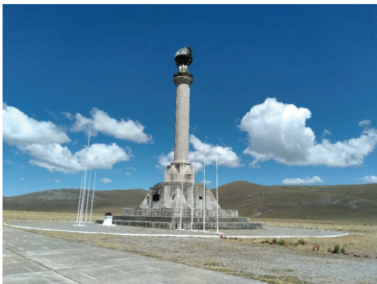
Figura 6: Obelisco a los vencedores de Junín (1925). 38