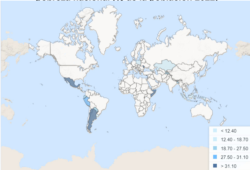
Ilustración 2 Tasa de incidencia de la pobreza, sobre la base de la línea de pobreza nacional (% de la población 2022)