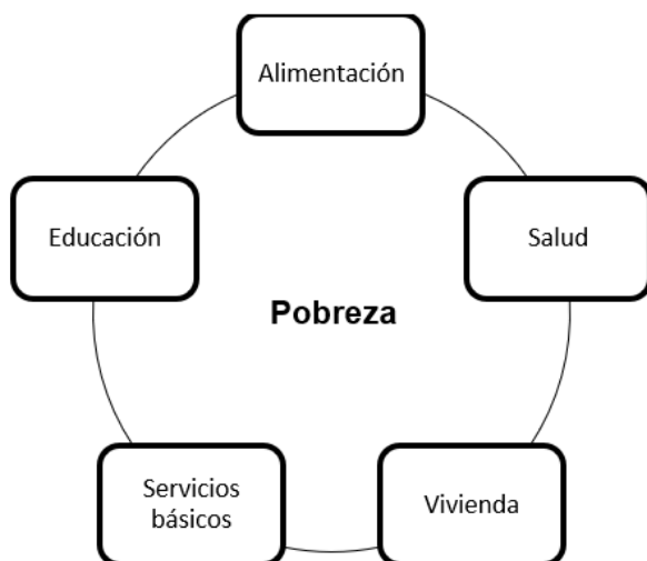
Diagrama 1 Aspectos de la pobreza

La falta de una adecuada alimentación, acceso a la salud, vivienda, servicios básicos y educación, contribuyen a la perpetuación y exacerbación de la pobreza en los seres humanos, creando un círculo vicioso que los atrapa en esta condición. Por lo tanto, abordar estos aspectos de manera integral es crucial para romper el ciclo de la pobreza y mejorar las condiciones de vida de las personas.