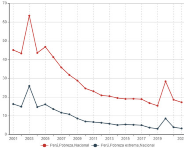
Gráfico 3 Población en situación de pobreza extrema y pobreza según área geográfica en Perú