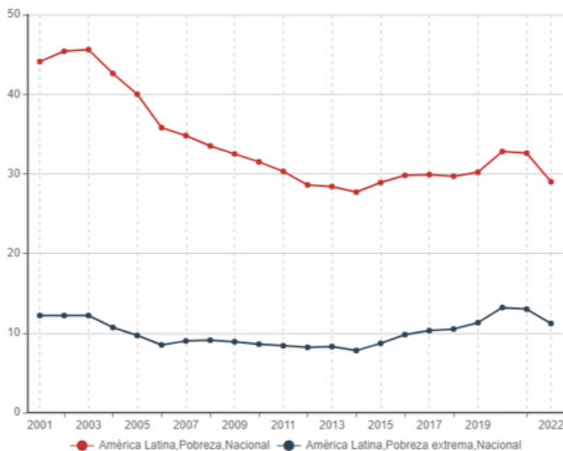
Gráfico 2 Población en situación de pobreza extrema y pobreza según área geográfica