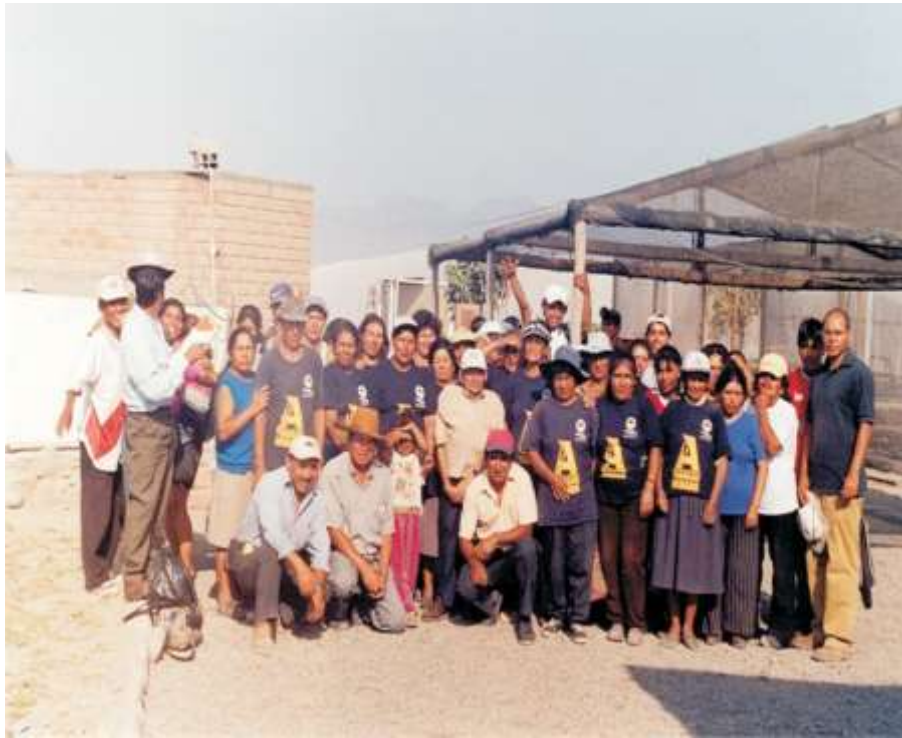
Figura 2. Personas beneficiadas por el programa “A trabajar urbano” en el Centro de Investigaciones Agroecológicas entre los años 2002 y 2003 con el apoyo del Ministerio de trabajo y promoción del empleo.