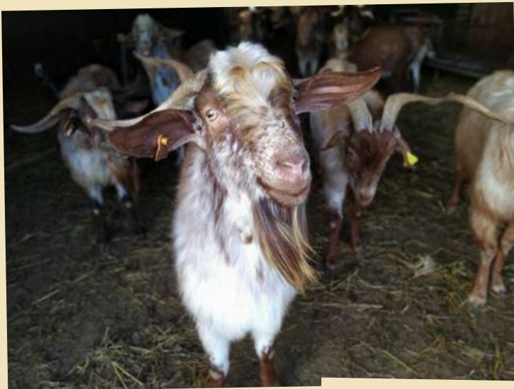
Enero: Arturo Benegasi.