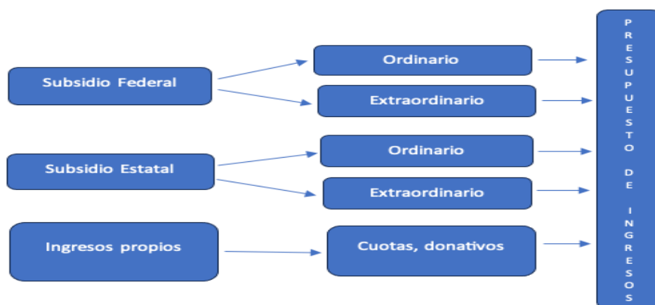
Figura 2. Composición de los ingresos de las UPE's.