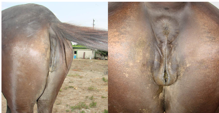
Figura 1. Observación posterior de la yegua con FRV. Observe la aparente normalidad de la región perineal y vulva.

Una yegua criolla colombiana, de trocha fina, color castaña, de 5 años de edad, 350 kg de peso y de primer parto, procedente del municipio de Ciénaga de Oro (Córdoba, Colombia), fue atendido por el servicio clínico ambulatorio de grandes animales de la Facultad de Medicina Veterinaria y Zootecnia de la Universidad de Córdoba. Se le realizó examen clínico general y reproductivo especializado, consistente en evaluación de la de la región perineal y vulva, así como evaluación por palpación rectal. Al examen clínico sistemático se evidenció aparente normalidad en la región perineal y vulvar (Fig. 1), sin embargo al evaluar el interior de la cavidad vulvar, se observó gran cantidad de materia fecal en su interior (Fig. 2a), al tacto rectal se evidenció la presencia de comunicación recto vaginal, con observación vaginal del dedo que el clínico introdujo por el recto de la yegua (Fig. 2b). Estos hallazgos obedecen