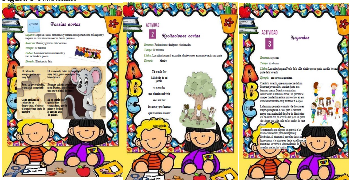
Figura 1 Cuadernillo

Nota: Se presenta un componente del cuadernillo de trabajo