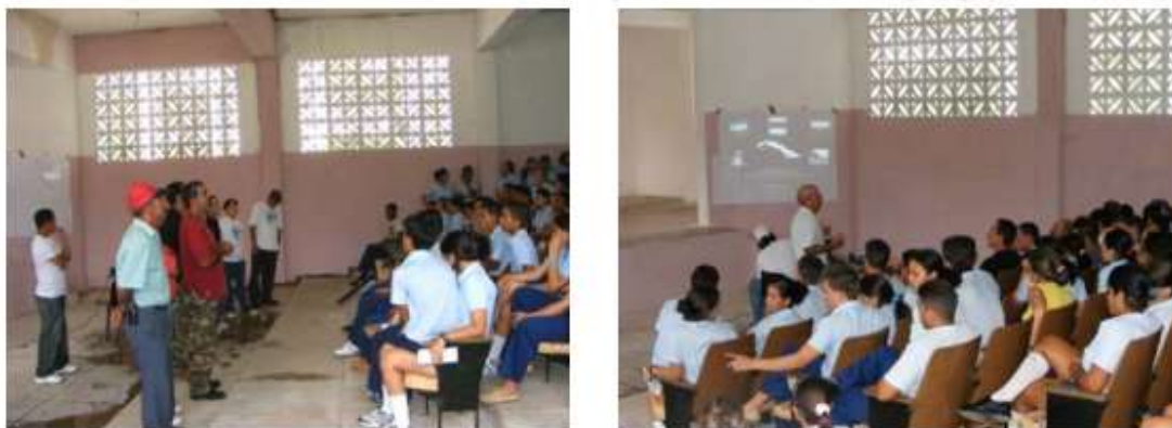
Fig. 3. Presentación del equipo, fundamentación del Día Nacional de las Áreas protegidas.

Posteriormente se hace énfasis en el estado actual de conservación, características ecológicas y la necesidad de conservar los valores locales para el futuro.