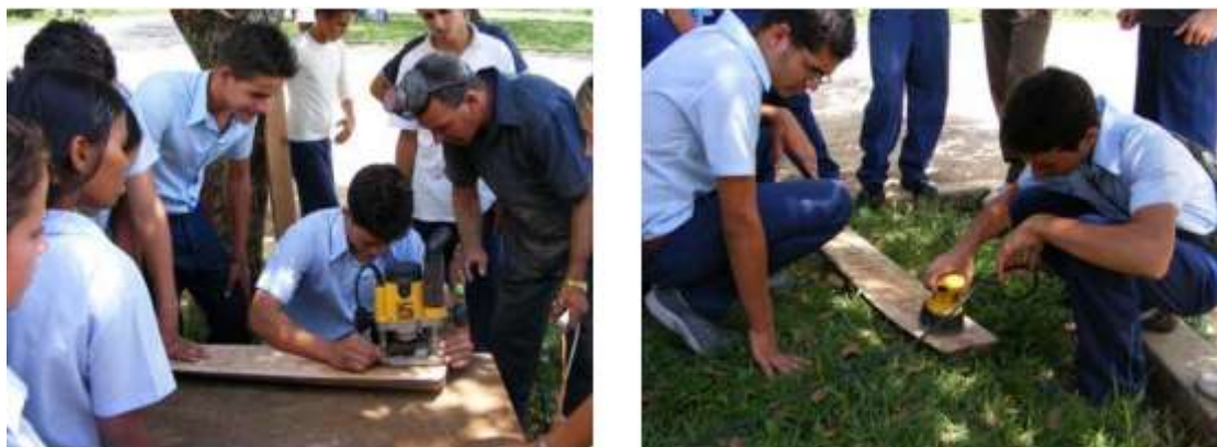
Fig. 6 Estudiantes elaborando señales

En un primer momento, especialistas y técnicos mostraron las características y funcionamiento del equipamiento correspondiente y algunas técnicas básicas para el diseño, empleando el manual de Señalética del SNAP. Posteriormente se convocó a los estudiantes presentes para elaborar señales con sus propias manos (Figura 6).