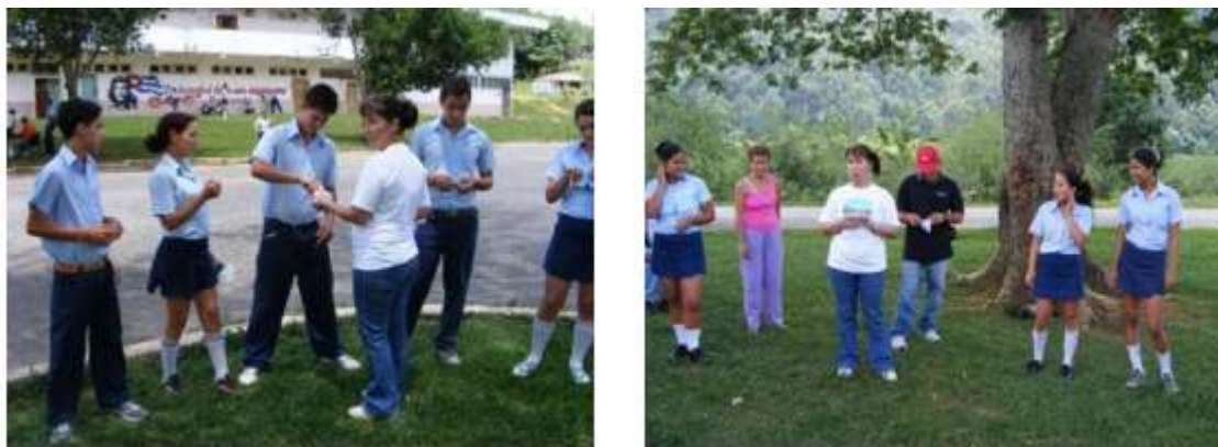
Fig. 7 Juego participativo. Tema: Las aves del Parque Nacional Viñales.

De manera simultánea a la confección de señales, se realizó un juego participativo con el objetivo de reforzar el conocimiento sobre diversas especies de animales, haciendo énfasis en aquellas que habitan en el Parque Nacional Viñales. Así se distribuyó el grupo creando un círculo en el que cada estudiante recibió un papel con el nombre de un animal (Figura 7).