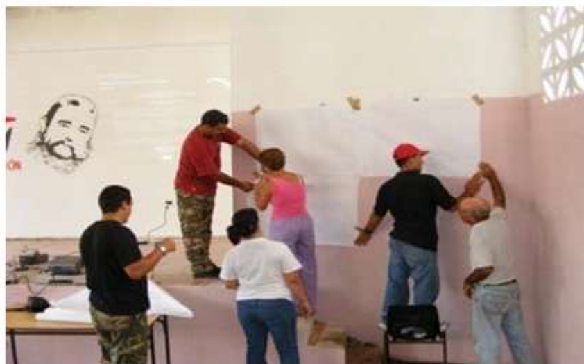
Fig. 2. Preparación de pantalla rústica

La dirección de la escuela por su parte convocó a la mayoría de estudiantes y profesores para en el horario previamente acordado comenzar el programa en plenario, utilizando las capacidades existentes en el teatro del propio centro. Para ello se hicieron varias pruebas de instalación y proyección de manera que se garantizara la mayor visibilidad de la información a lo que hubo que añadir algo de creatividad para lograr una pantalla rústica (Figura 2). Solución: papelógrafos pegados entre sí y a su vez en la pared.