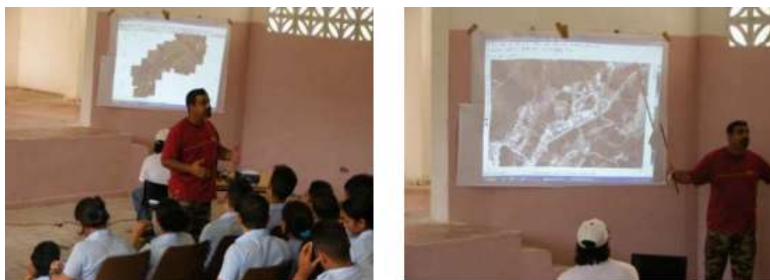
Fig. 4. Observación de imágenes georeferenciadas mediante Mapinfo 9.0

Igualmente se explican las posibilidades de recreación, uso público y económico que se desarrollan en el área protegida, dando paso al comentario de las principales amenazas que se manifiestan en el Parque, mediante la observación de diversos mapas y una composición de imágenes satelitales georeferenciadas que abarcan toda el área protegida, visualizadas mediante MapInfo 9.0 (Figura 4)