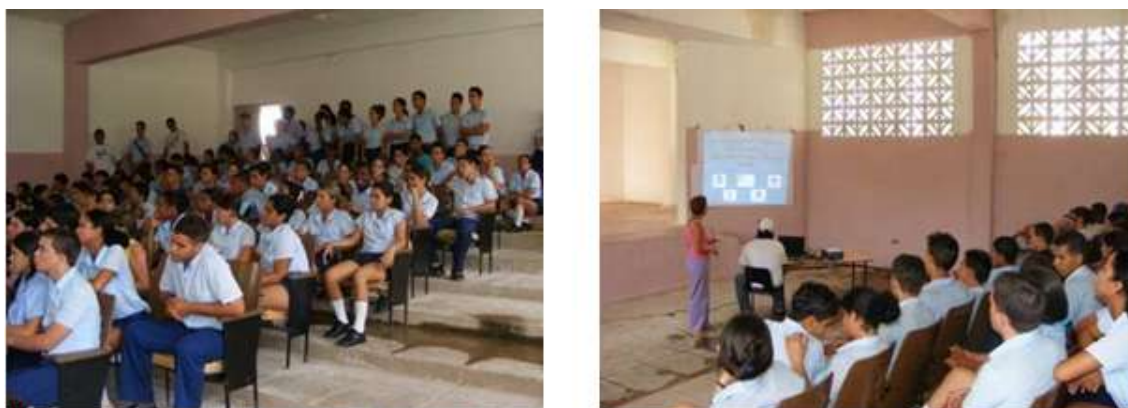
Fig. 5. Permanencia de los estudiantes y presentación de acciones de cooperación internacional en la localidad