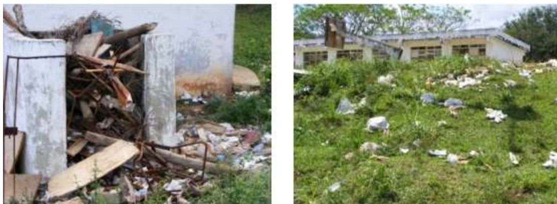
Fig. 8. Vertimiento incontrolado de residuos sólidos.