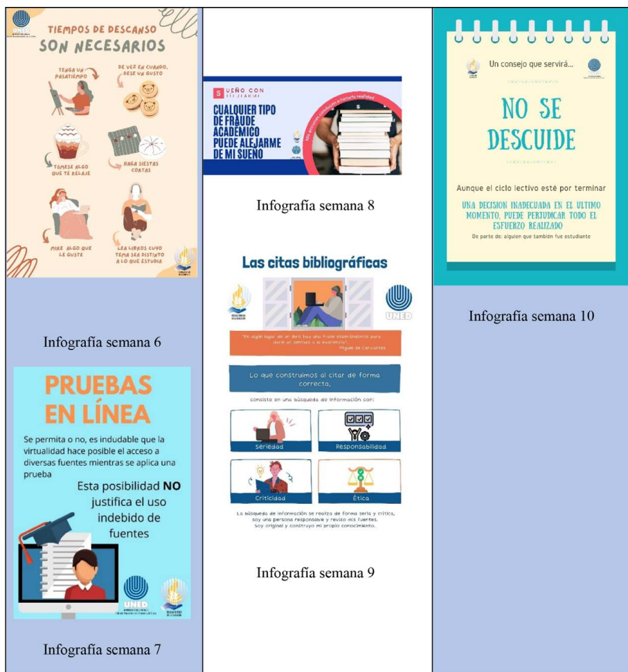
Figura 2 Muestra de infografías divulgadas durante el tercer cuatrimestre del 2021 y del primer cuatrimestre del 2022. Segunda parte

Nota: el cuadro muestra una selección de cinco infografías divulgadas, que corresponden a las semanas 6, 7, 8, 9 y 10 del tercer cuatrimestre del 2021 y del primer cuatrimestre del 2022 (elaboración propia).