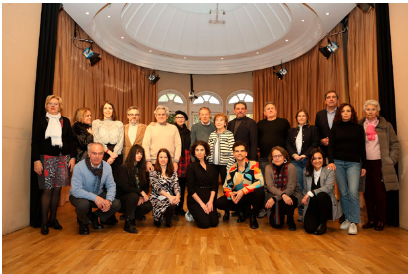
Organizadores y colaboradores