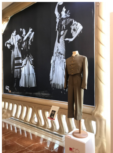
Traje José Greco

En esta exposición se muestran cuatro piezas que se conservan en el museo de la Casa de la Danza de Logroño: