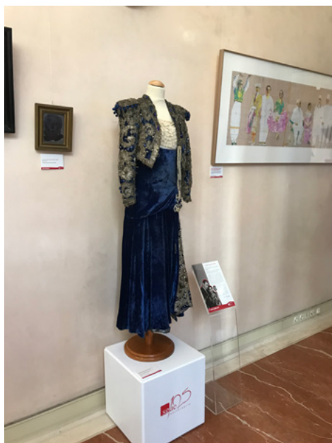
Traje Carmen Amaya