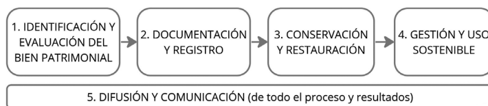
Figura 1. Esquema desde un enfoque tradicional de las fases del proceso de la conservación de patrimonio. Autora: Luisa Walliser

Ahora más que nunca, en un momento en el que las redes sociales se han convertido para muchas personas en el medio habitual de información, lo que no se comunica no existe. Por eso es cada vez más importante incorporar la comunicación y divulgación de todo el proceso de forma transversal a todas las fases: desde su identificación y valoración (que muchas veces parte de iniciativas sociales), a todo el proceso de toma de decisiones y desarrollo de acciones de documentación, intervención y gestión posterior.