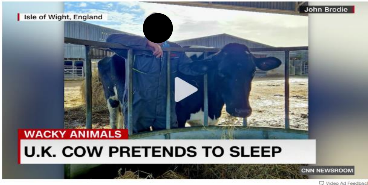
Figura 5 – Notícia da CNN