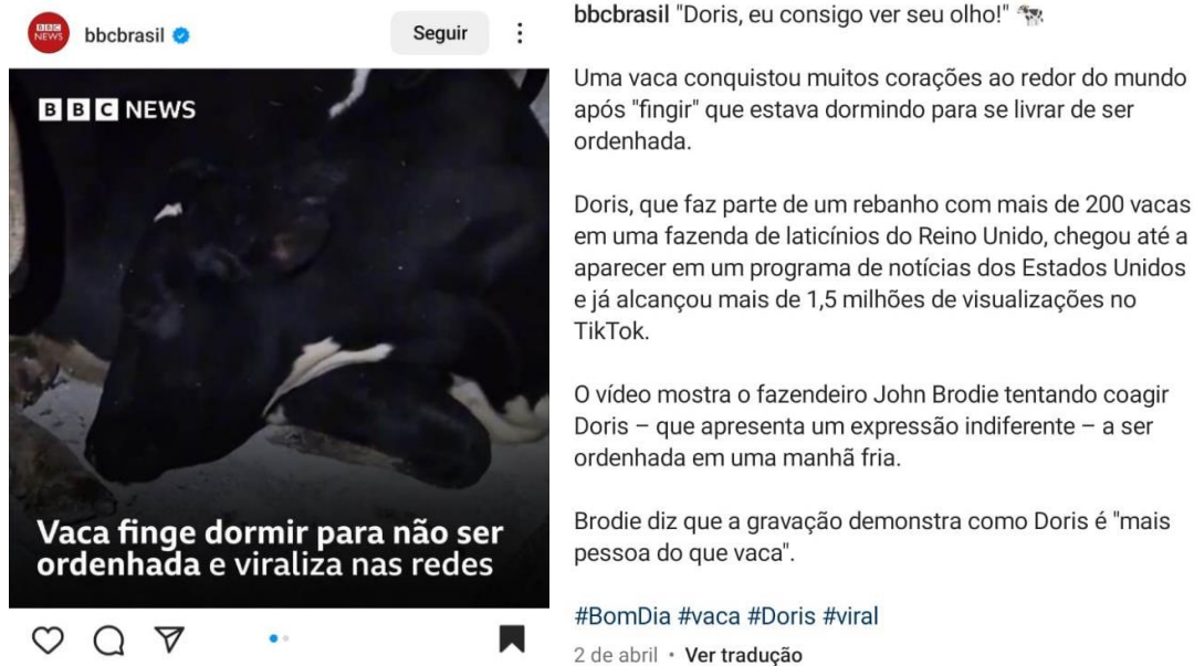
Figura 2 – Post da @bbcbrasil

O primeiro contato com o assunto em questão se deu por um post no instagram , publicado no dia 2 de abril de 2023 no perfil da BBC Brasil (@bbcbrasil), mostrado abaixo: