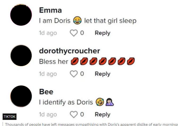
Figura 4 – Reações dos internautas no TikTok