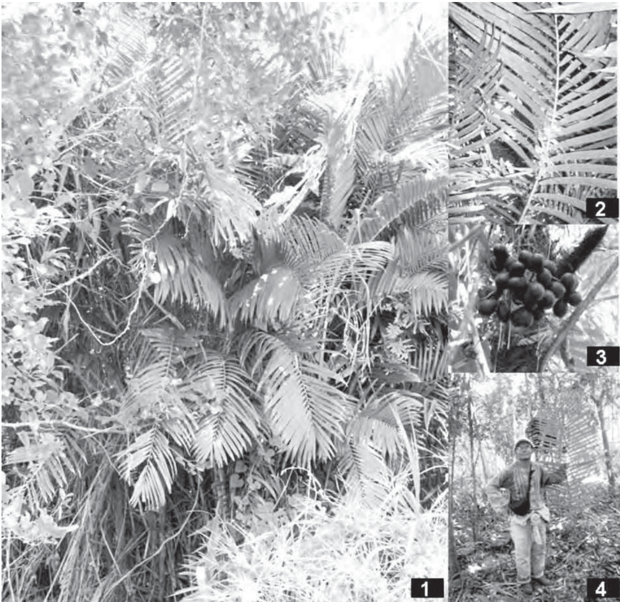
Figuras 1-4.- B. major . 1. Hábitat; 2-4. Detalle de una hoja. 3. Detalle de los frutos.

Fenología: Esta especie se caracteriza por que crece formando densos macollos, debido a que sus raíces presentan un crecimiento vegetativo rizomatoso, lo que la hace una de las plantas dominantes en el sotobosque de las selvas de Canacoite. Esta característica la hizo famosa en la Batalla del Jahuactal contra los Franceses, ya que estos fueron conducidos a una zona ocupada con Jahuacte lo que facilitó su derrota por parte de los indígenas. En la región de la Chontalpa el Jahuacte es un elemento frecuente en los potreros y posiblemente esté siendo favorecido por la quema