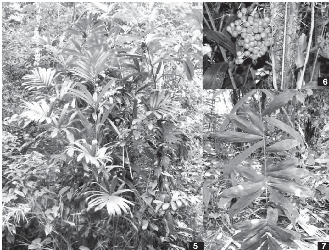
Figuras 5-7. B. mexicana . 1. Hábitat. 2. Detalles de los frutos. 3. Detalle de una hoja

Distribución: Cárdenas, Huimanguillo, Centro,