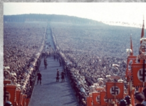
CONGRESO DE NUREMBERG. CAMPO ZEPELIN. 1938.

Alemania había sido la nación mayor afectada al término de la primera guerra, ya que perdió parte de su territorio y se limitó a