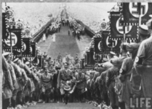
CONGRESO DE NUREMBERG.

en distintas partes del mundo, y por otro lado Francia había alcanzado casi el mismo nivel de poder inglés durante cierto periodo con Napoleón, lo cierto es que ambas naciones tenían una fuerte presencia económica a nivel internacional. Pero ambos países y Europa en general habían perdido poder e influencia debido a la Primera Guerra Mundial; todo el viejo continente había quedado devastado y peor aún, endeudado con los Estados Unidos, quien los había suplido de armas, petróleo y alimentos. Posteriormente, ocurre la crisis económica mundial conocida como la Gran Depresión en 1929, la cual va a estancar más a la economía europea, y hace retroceder el poco desarrollo que las grandes potencias habían conseguido durante la posguerra. Estados Unidos aun no se reconocía como potencia, pero era evidente que su constante desarrollo marcaba el paso, lento pero firme hacia un futuro como potencia. Toda la década de los treinta, las potencias europeas no sabían cómo salir de la crisis, una de las alternativas más efectivas, aunque riesgosa era la guerra, expandir más sus respectivos imperios, aspecto en el cual ya tenían amplia experiencia. Casi todos los países del sureste de Europa regresaron a la monarquía, debido a la crisis económica. Es en este punto, donde la entrada en escena de Hitler y Mussolini tiene un enorme papel.