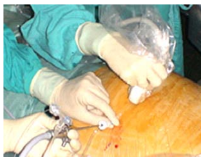
Figura 2. Fetoscopia: introduciendo un balón intratraqueal en un caso de hernia diafragmática aislada (Hospital Clínica Barcelona).

En enero de 2009, el Instituto Nacional Materno