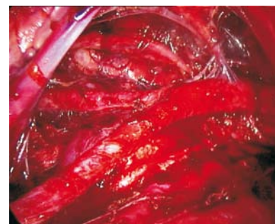
Figura 4. Linfadenectomía aórtica extraperitoneal, abordaje izquierdo. Vista final.

tado la técnica en el abordaje inicial para la cirugía de estadiaje por cáncer de ovario y endometrio. En total, se realizó 17 linfadenectomías paraaórticas extraperitoneales, 8 por cáncer de ovario, 8 por cáncer de endometrio y una por cáncer de cérvix localmente avanzado, con un promedio de 12 ganglios resecados para el grupo de cáncer de ovario y 7 ganglios para el de cáncer de endometrio (la mayoría de los cuales fueron inframesentéricos), semejante a lo encontrado en el abordaje transperitoneal y por laparotomía. La ventaja es la disminución de lesiones graves de los grandes vasos, debido al plano horizontal y paralelo de la disección ganglionar. Los límites de esta disección son exactamente iguales a los del abordaje transperitoneal.