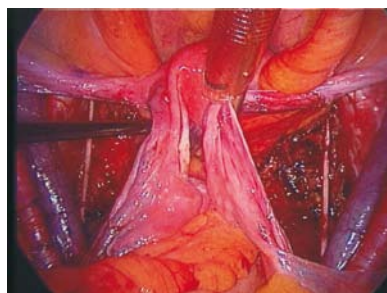
Figura 1. Linfadenectomía pélvica bilateral.

ginecología oncológica, desde agosto de 2007, habiendo tenido una experiencia previa en los años 90. Desde entonces, se ha realizado 63 linfadenectomías pélvicas, con un promedio de 16 ganglios resecados. Cuatro pacientes (6%) han presentado complicaciones, representadas básicamente por linfoquistes, los cuales fueron observados o drenados por laparoscopia. No hubo complicaciones mayores. Por lo tanto, estamos ante una técnica factible, que necesita una curva de aprendizaje pero con grandes ventajas para la paciente y la institución prestadora de servicios de salud.