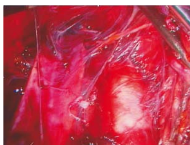
Figura 2. Linfadenectomía aórtica transperitoneal.