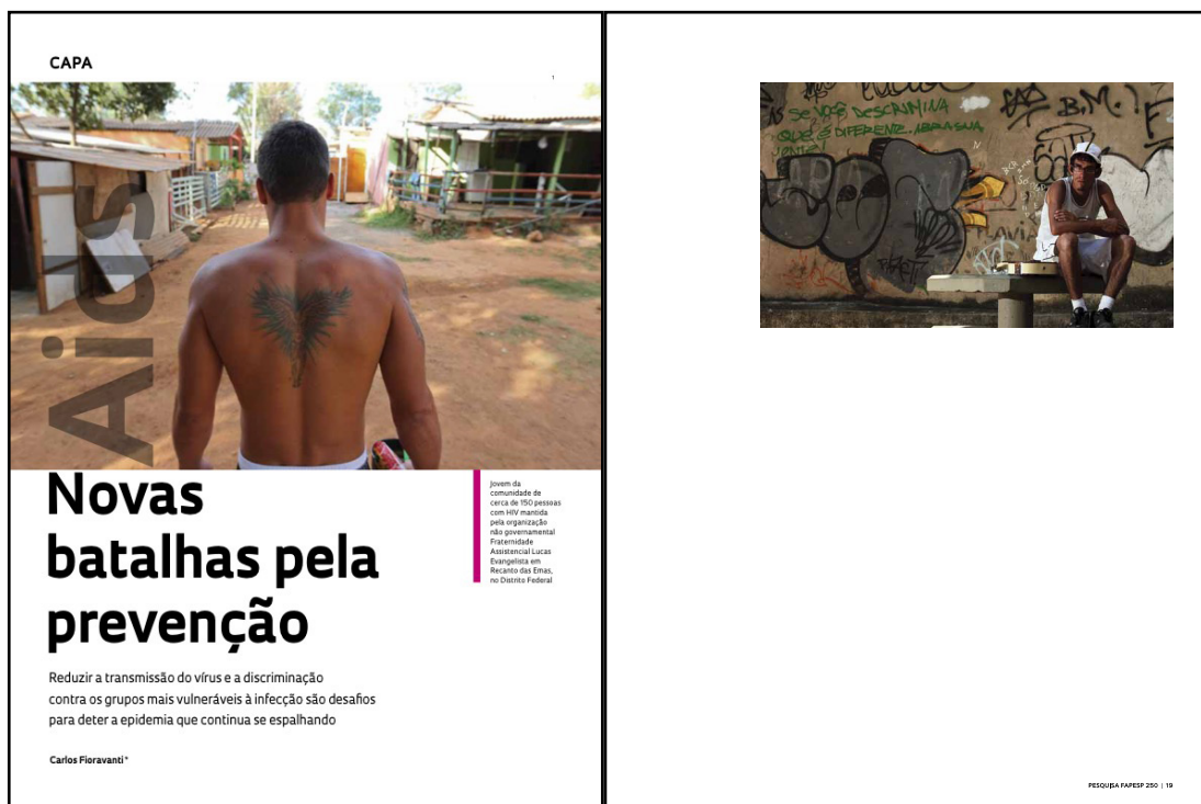
Figura 2 – Páginas 18 e 19 da revista Pesquisa Fapesp