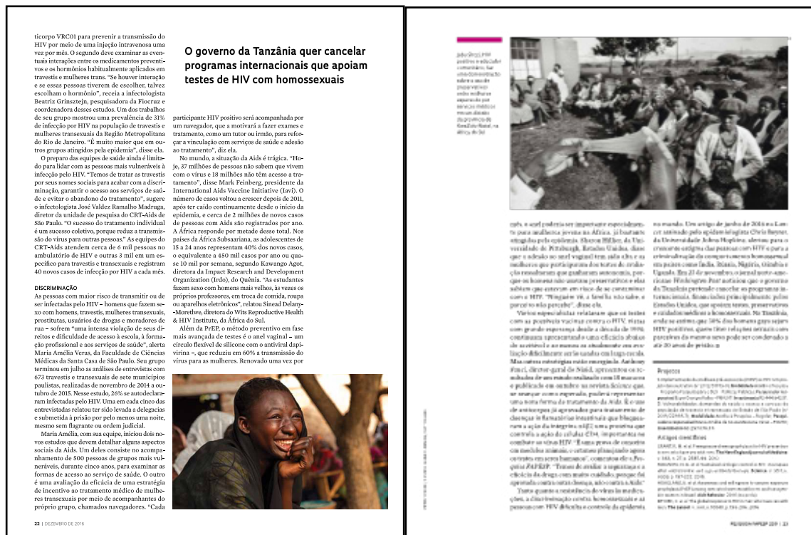
Figura 4 – Páginas 22 e 23 da revista Pesquisa Fapesp