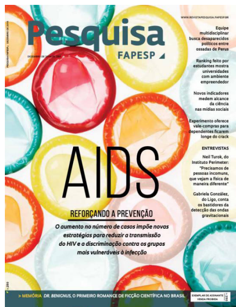
Figura 1 – Capa reportagem “Aids. Reforçando a prevenção” da Revista Pesquisa Fapesp .