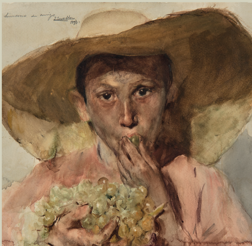
Joaquín Sorolla Bastida. Comiendo uvas, 1898. Acualera sobre papel. Museo Sorolla, n° inv. 00427

XLV JORNADAS DE VITICULTURA Y ENOLOGÍA TIERRA DE BARROS V CONGRESO AGROALIMENTARIO DE EXTREMADURA