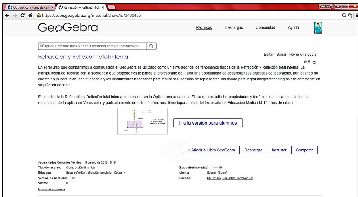
FIGURA 1: El simulador compartido en GeoGebraTube.

Para lograr la simulación de los fenómenos de refracción y reflexión total interna con este recurso fue necesario ajustar convenientemente los deslizadores asociados al índice de refracción de cada medio que interviene en la situación. Luego de esto, debe activarse la opción Animación Automática al deslizador asociado al ángulo de incidencia del rayo luminoso para poder observar el funcionamiento del simulador. La figura 1 muestra la apariencia final del simulador propuesto en este trabajo. El mismo puede ser manipulado y descargado directamente desde: https://tube.geogebra.org/material/show/id/1400495 .