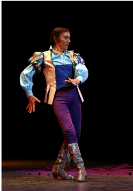
Ángel en Farruca

El Bosque de la Danza de Logroño podemos considerarlo como un adolescente en primer grado. Se plantaba su primer árbol en el año 2009 llegando a contarse sesenta ejemplares en el año 2015, en los 3.000m 2 que el Ayuntamiento de la capital riojana había destinado a tal efecto.