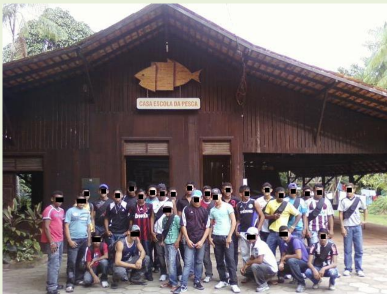
Figura 1: Casa Escola da Pesca e alunos do ensino fundamental