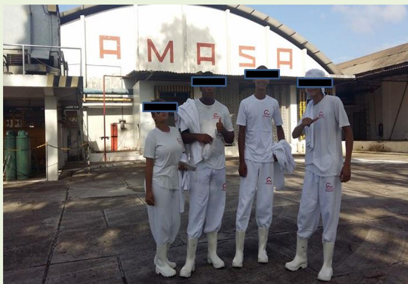
Figura 10: Visitas técnicas na formação profissional