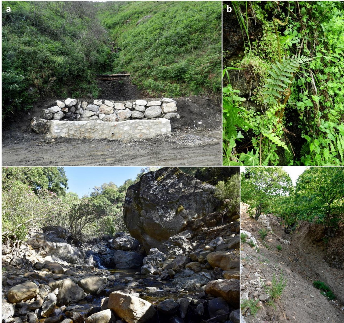
Figura 3. Algunos impactos sobre el hábitat de Dryopteris affinis en el Valle del Genal: a) construcción de charca para anfibios (Júzcar) y b) ejemplar rebrotando tras la agresión por las obras; c) la Garganta de la Cuesta, en el Monte del Duque (Casares), carece de vegetación contigua al cauce por la alta densidad de especies cinegéticas; d) arroyo sin vegetación en castañar (Pujerra).

En el Arroyo Guarri, afluente del Arroyo Guadarín y donde se ubicaba la localidad de Faraján, se recorrieron 0,5 km, encontrando dos núcleos de individuos. El ejemplar adulto del segundo núcleo es el mismo hallado en 2006, lo que aporta indicios acerca de la longevidad de estas plantas.