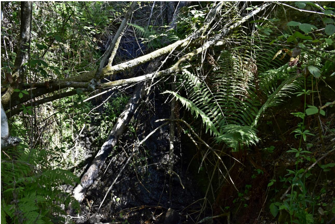
Figura 1. Dryopteris affinis en su hábitat natural en el Valle del Genal.

Dryopteris affinis (Lowe) Fraser-Jenk. subsp. affinis ( sensu Fraser-Jenkins, 2007) (Figura 1), es un diploide apomítico de origen híbrido pero de parentales no conocidos (Fraser-Jenkins, 2007), aunque algunos estudios señalan a Dryopteris oreades Fomin y a otra especie diploide sexual desconocida, ancestral al complejo de Dryopteris wallichiana (Spreng.) Hyl., y que se ha denominado a efectos prácticos en estudios genéticos como " Dryopteris semiaffinis " (Krause, 1998; Bujnoch, 2015; Freigang et al. , 2017). Con una distribución paleártica occidental, D. affinis es frecuente en la Península Ibérica, rarificándose hacia el sur (Salvo & Arrabal, 1986). En Andalucía es una especie considerada Vulnerable (Cabezudo et al. , 2005), estando presente en cinco regiones y provincias (Fraser-Jenkins, 1982; Delgado Vázquez & Plaza Arregui, 2006; Lorite, 2016) (Figura 2): Huelva, Sevilla, Cádiz, Málaga y Granada. El Valle del Genal (Málaga) representa la única región que no está dentro de ningún Parque Nacional ni Parque Natural, aunque sí está incorporada a la Red Natura 2000 (Figura 2) con el objetivo de la conservación de sus hábitats, conforme a la Directiva 92/43/CEE.