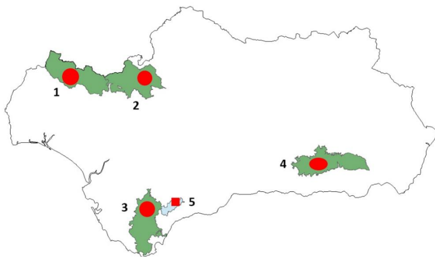
Figura 2. Distribución de Dryopteris affinis en Andalucía (en rojo) y su relación con los espacios protegidos: 1, Parque Natural Sierra de Aracena y Picos de Aroche; 2, Parque Natural Sierra Morena de Sevilla; 3, Parque Natural Los Alcornocales; 4, Parque Natural y Parque Nacional de Sierra Nevada; 5, Zona de Especial Conservación (ZEC) ES6170016 Valle del Río Genal.

término municipal de Júzcar. Una de estas charcas fue realizada en la última localidad descubierta de D. affinis , destruyendo su hábitat y dañando a algunos de los individuos (Figuras 3a y 3b). Y pese a la advertencia transmitida a la Consejería por el daño ecológico ocasionado, no se detuvieron las obras para la construcción de las charcas para anfibios, por lo que se ha realizado el presente estudio para advertir sobre el impacto que este tipo de prácticas pueden tener en el entorno, en general, y en la conservación de la flora, en particular.