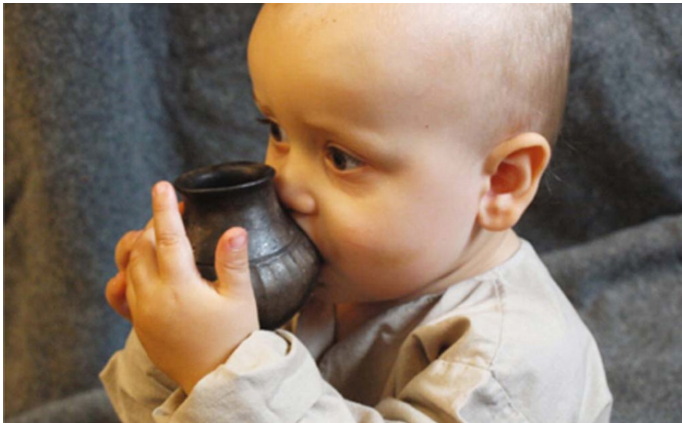
Figura 2. Bebé con reproducción de biberón.

formas eran circulares, antropomorfas, zoomorfas, geométricas, y el material usado era cerámica, bronce o plata.