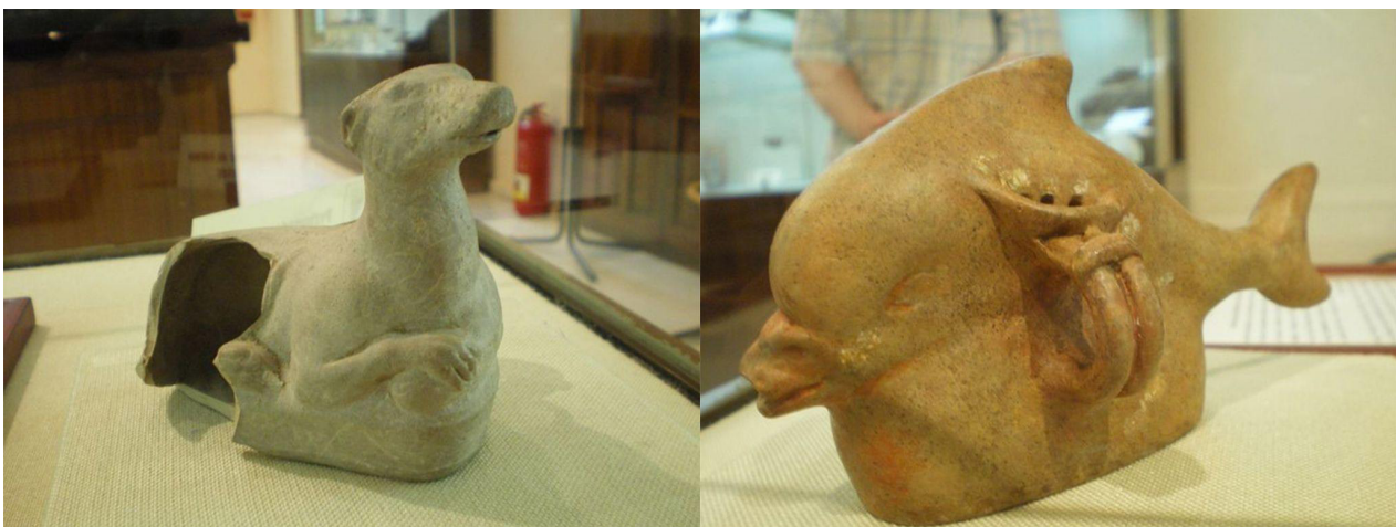
Figura 1.a. Biberón con forma de perro. Fuente: Abel Marco Freixa. / Figura 1.b. Biberón con forma de delfín. Fuente: Abel Marco Freixa.

Del mismo modo, hacemos referencia a los sonajeros o crepitacula , elementos que han servido a lo largo de la historia para entretener a los bebés, y en época romana, también como elementos protectores. Sus