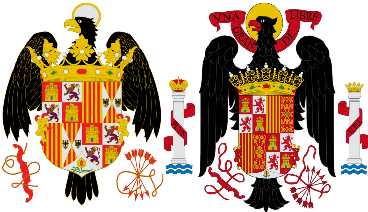
Figura 1. a) Escudo de los Reyes Católicos. Fuente . b) Escudo franquista. Fuente .

Los Reyes Católicos fueron representados en muchos formatos durante el franquismo, pero posiblemente uno de los más relevantes fuese en la reinterpretación del escudo de armas. Las armas de Isabel y Fernando evolucionaron a lo largo de su reinado, pero las más conocidas consistían en un cuartelado con las armas de Castilla-León en el primer y tercer cuartel, y las de Aragón y Aragón-Dos Sicilias en el segundo y cuarto, con Granada en punta (Menéndez Pidal de Nascués, 2011, pp. 319-330). Este escudo era soportado por el águila de San Juan, símbolo de su devoción al apóstol (Vidotte, 2019). El 2 de febrero de 1938 Franco decretó el uso