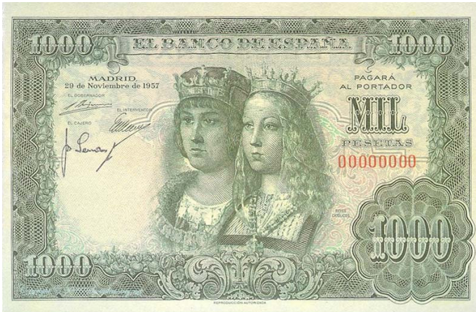
Figura 3. Billeto de 1.000 pesetas con el retrato de los Reyes Católicos.

a nombre de ella (Francisco Olmos, 2002, pp. 129-130). Por tanto, aunque ambos ostentaron el poder, la reina no se mostró como la abnegada esposa sumisa que imaginaban en el régimen.