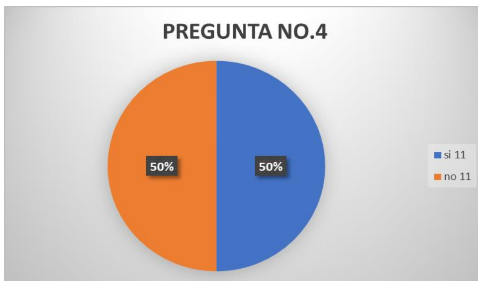
Figura 4. Toma de decisión.

4.- ¿Tiene usted conocimiento si la eutanasia se encuentra en las normas legales de nuestro país?