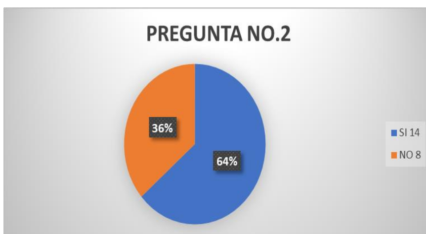
Figura 2. Se aplica de la eutanasia personas con enfermedad catastrófica.

2.- ¿Se encuentra de acuerdo que se aplique la eutanasia a personas con enfermedades catastróficas?