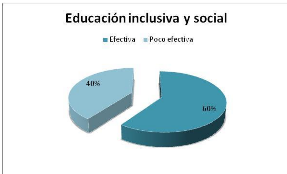
Figura 2. Educación inclusiva y social.