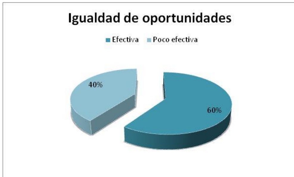
Figura 3. Igualdad de oportunidades.