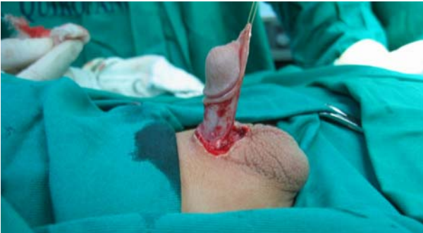
Vista lateral.