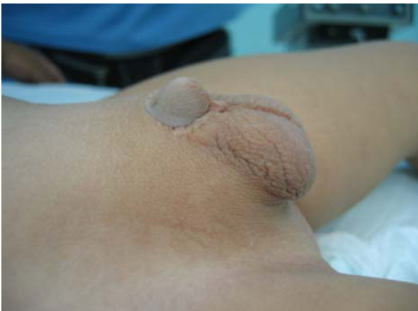
Resultado final ANTES.