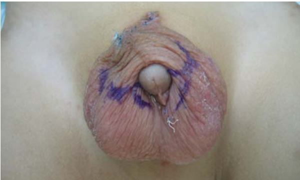
Planificación del segundo tiempo.

Posteriormente a las 3 semanas se procedió a la segunda cirugía, que consistió en formar el tubo de piel del cuerpo del pene, realizando cierre directo de la piel del escroto con técnicas de Z plastias para evitar retracciones, fotos 7 y 8; esquema 2.