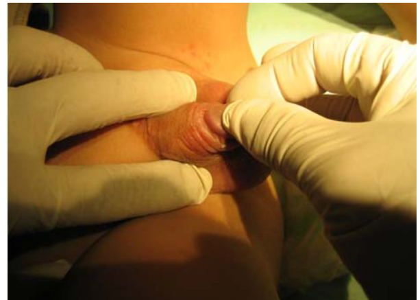
Segundo tiempo.